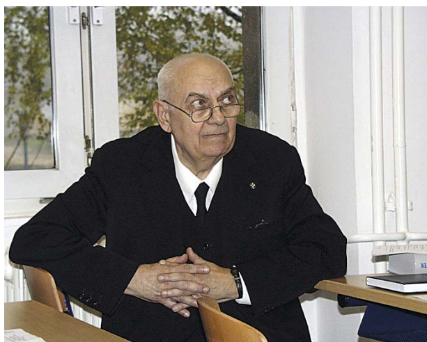
Dr. Fábry György a Tanszék 40 éves jubileumán 2002-ben

A szilikátipari ágazati képzés szintén Fábry professzor irányításával és szervezésével indult el 1966-ban, és 1968-ban 10 fő adott be diplomatervet. Akkoriban a gépész évfolyam tíznél is több tanulókból állt, amelyből három csoport vegyipari gépész volt. A második év végén alakították ki az új szakirány csoportját úgy, hogy az egyik „vegyiparos” tanulókból lettek a „szilikátos” hallgatók.