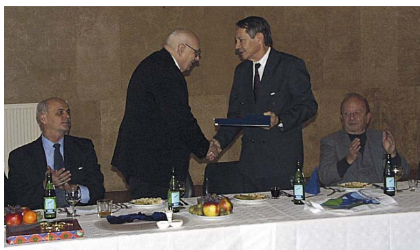
Signum Aureum Facultatis kitüntetés átadása 2002-ben