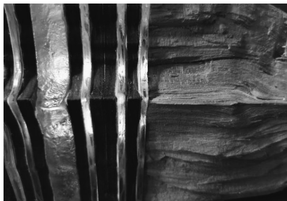
6. ábra. Újrahasznosítás, Dadaizmus, "Tűzifa szoborrá emelve" Anyaga fa, üveg, rugalmas kompozit, részlet.

A sorolás száliránya szándékosan ütköztetve, viccesen boldogítóan. De jelenkorunkban az újrahasznosítás egy példamutató jövőképben? – Miként lehet a tönkrement hasznos anyagokat használni más felhasználási területen.