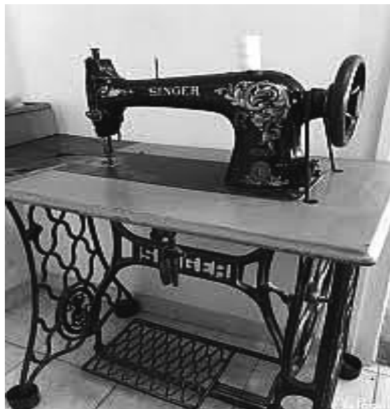
8. ábra. „Örökéletű darab” Singer varrógép

Ilyen pl.: a Singer varrógép csak a bőr szíja öregszik. Sok háztartásban megtalálható még ma is, pedig 1910 -ből van számozott darab.