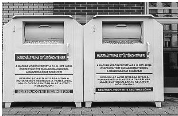
4. ábra. Újrahasznosítás, ruhagyűjtő konténer