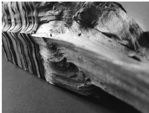
5. ábra. Újrahasznosítás, Dadaizmus, "Tűzifa szoborrá emelve" Anyaga fa, üveg, rugalmas kompozit.

A képzőművészet egy izgalmas és tanulságos időszaka a Dadaizmus. „Talált tárgy” vagy újrahasznosítás viccesen boldogítóan. De jelenkorunkban az újrahasznosítás egy példamutató jövőképben? – Miként lehet a tönkrement hasznos anyagokat használni más felhasználási területen.