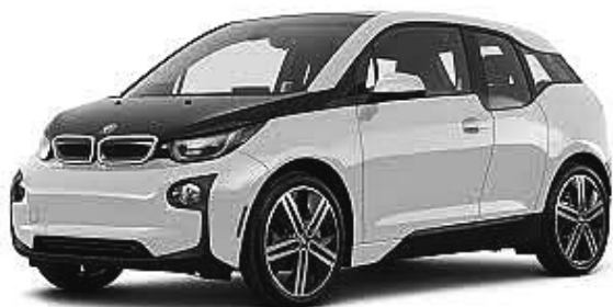
2. ábra. BMW I. 3. hosszútávú használatra

Am a gazdasági menedzsment támogatását nem tudták megszerezni, ők komplett autókat akartak, minél többet eladni és ezzel minél nagyobb profitot realizálni. Sajnos e miatt ez csak egy utópisztikus gondolat lett. A tervező gárda öko-elkötelezett tagjai később el is hagyták a gyár kötelékét. Hamarosan a gazdasági képviselőknek is be kell látniuk, hogy ez a helyes irány, mert ezt igénylik a vásárlók, ehhez kell kialakítani a pénzügyi megoldásokat.