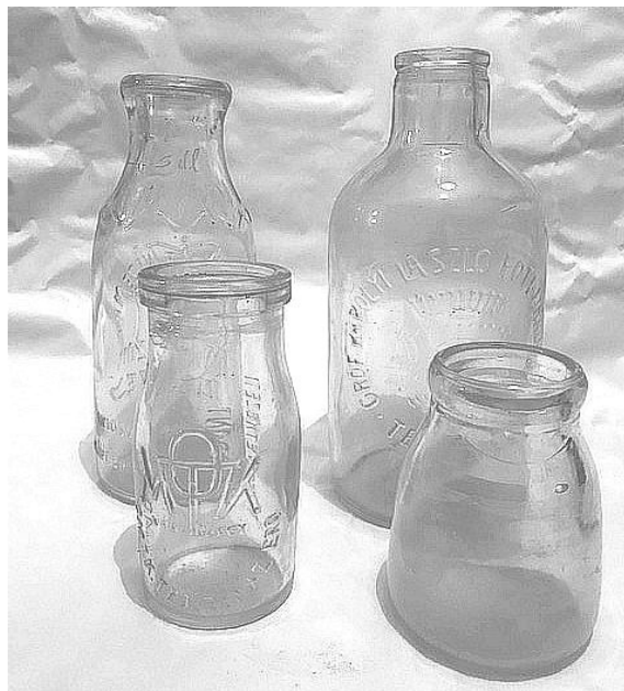
1. ábra. Visszaváltható üveg palackok, újrahasznosítás

Ezek a palackok vastag falúak, száj kialakításuk az újra tölthetőség miatt meg vastagítva a töltő fejhez van kialakítva. Felíratozása lehet matrica, szitázott vagy plasztikus préselt. A vastag masszív falvastagság a tartós használat miatt van, kevésbé sérülékeny. Anyaga olcsó kategóriájú üveg alapanyag présáruhoz.