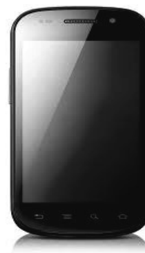
12. ábra érintő képernyős telefonok, ezek már a számítógépeink helyett is jól használhatóak