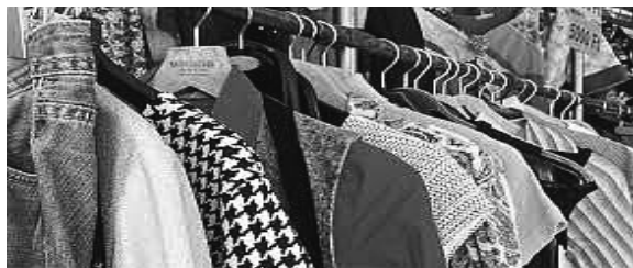
3. ábra. Használtruha leadása, marka hűen