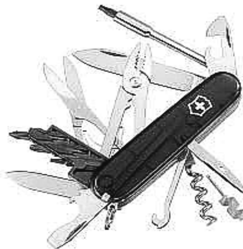
9. ábra „Örökéletű darab” svájci bicska

Ilyen például a svájci bicska. Mely egyre több funkcióval rendelkezik. a rekordja jelenleg 36 funkció.