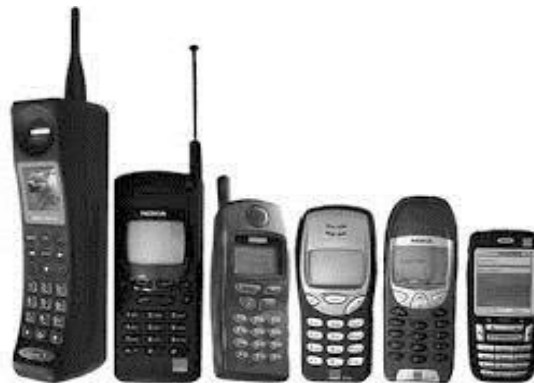
11. ábra Mobiltelefon változásai, műszaki fejlődés miatt erős küllemváltozás, márkától függetlenül