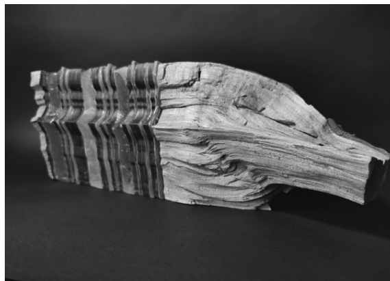
7. ábra. Újrahasznosítás, Dadaizmus, Anyaga fa, üveg, rugalmas kompozit

A sorolás száliránya szándékosan ütköztetve, viccesen boldogítóan. De jelenkorunkban az újrahasznosítás egy példamutató jövőképben? – Miként lehet a tönkrement hasznos anyagokat használni más felhasználási területen.