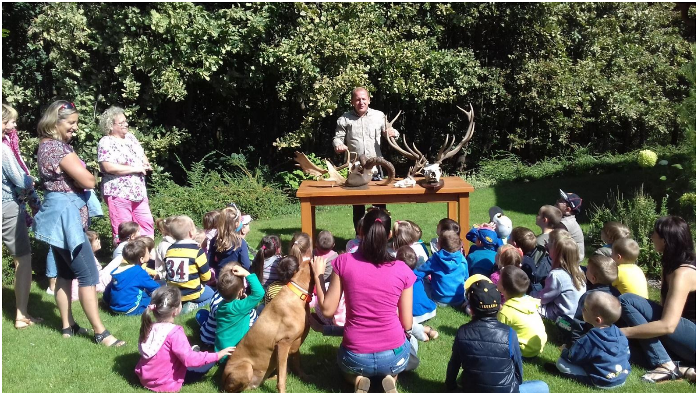
3. kép: A magyar erdők vadjaival ismerkednek az óvodások, miközben trófeákat tanulmányoznak

A jelenségek, folyamatok szemléltetését, megértését szolgáló eszközök közül különböző típusú modellekkel is megismertetjük a gyermekeket úgy, mint virágmodellek, domborzati vagy animációs modellek. Fontos azonban különbséget tennünk a modell, mint eszköz és a modellezés, mint módszer között, ugyanis míg a modellek szinte minden oktatási intézményben jelen vannak, és többé kevésbé használják is azokat a tanárok, addig a modellezés módszere kevés pedagógus és így még kevesebb diák számára ismert (Huszi és Revákné, 2012). Mivel alkalmazásuk hatékonyságát már több kutatás is bebizonyította ezért előszeretettel alkalmazzuk azokat az erdei iskolai programjaink során, hiszen e képességek révén a tanulók természettudományos ismeret-elsajátítási folyamata hatékonyabbá, gondolkodásuk analitikusabbá válik, jobban odafigyelnek a részletek elemzésére, azok megértésére valamint a rész-egész viszonyának összefüggéseire (Swartz és White, 2005).