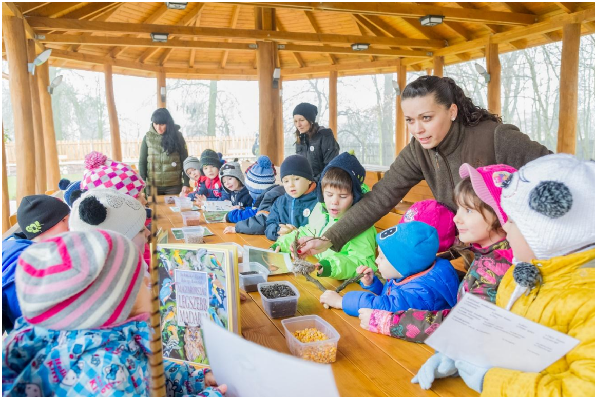
1. kép: Az óvodások 3D-s képeket, plakátokat készítenek termésekből és különböző erdei kincsekből

Erdészeti erdei iskola révén kiemelt szerepet szánunk a fenntartható erdőgazdálkodásnak továbbá az erdők hármaskörének, az erdész munkája és a fa életútjának bemutatására. Erdei sétáink alkalmával e témakörök kapcsán nagy hangsúlyt fektetünk a természet- és környezetvédelem alapelveinek valamint az erdei viselkedés szabályainak betartására, miközben a globális környezetvédelmi problémák megelőzésének fontosságára is felhívjuk a tanulók figyelmét. Ezeket azért is tartjuk jelentősnek, mert a tanítási órákon valamint a tankönyvekben ilyen témakörökkel egyáltalán nem vagy csak érintőlegesen foglalkoznak.