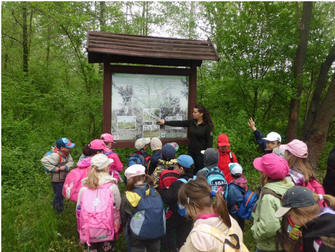
2. kép: Erdőgazdálkodási ismereteket tanulnak az iskolás diákok

Ezen kívül nagy hangsúlyt fektetünk a vadgazdálkodásra, a Magyarországon vadászható vadfajok, vadászati módok és idények ismertetésére, a vadász öltözkéneke és eszközeinek szemléltetésére. Az óvodás és alsó tagozatos diákok esetében elsősorban az erdőszel vagy vadással folytatott beszélgetések illetve a szituációs játékok vezetnek el a problémák megoldásához. A felső tagozatos vagy középiskolás tanulók esetében már bátran alkalmazzuk többek között a korábbiakban már említett projektmódszert, mely a kritikai gondolkodáson és a kreativitáson túl fejleszti a kommunikációs és kollaboratív képességeket is.