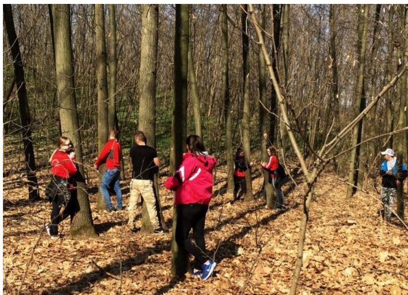
4. kép „Köszönöm gyakorlat”, melyben kifejezhetik érzelmeiket egy másik élőlény iránt, megköszönhetik neki, hogy létevel hozzájárul életükhöz.

A hallgatók az erdei iskolában a hagyományos módszerektől elszakadva éppen azokkal a pedagógiai módszerekkel tanulnak maguk is, amelyekkel leghatékonyabban lehet hatni a motivációra, az érzelmi viszonyulásra (4. kép). Olyan módszereket láthatnak és tanulhatnak, amelyek elsajátítására az egyetem falai között kevesebb alkalom nyílik. Egy olyan közegben lehetnek, ahol az egész intézmény a környezet iránti érzékenység és tudatosság fejlesztésére lett felépítve. Így ha rövid időre is, de megtapasztalják a fenntarthatóságra nevelés egész intézményes szemléletét (Henderson & Tilbury, 2004; Néder et al., 2014; Könczey et al., 2016), maguk is formálódnak, erőt és motivációt kapnak a fenntarthatóbb szemléletmódra és életvitelre való áttéréshez. Hiszen csak a hiteles úton járó környezeti nevelők lehetnek hatékonyak a további generációk szemléletformálásában is.