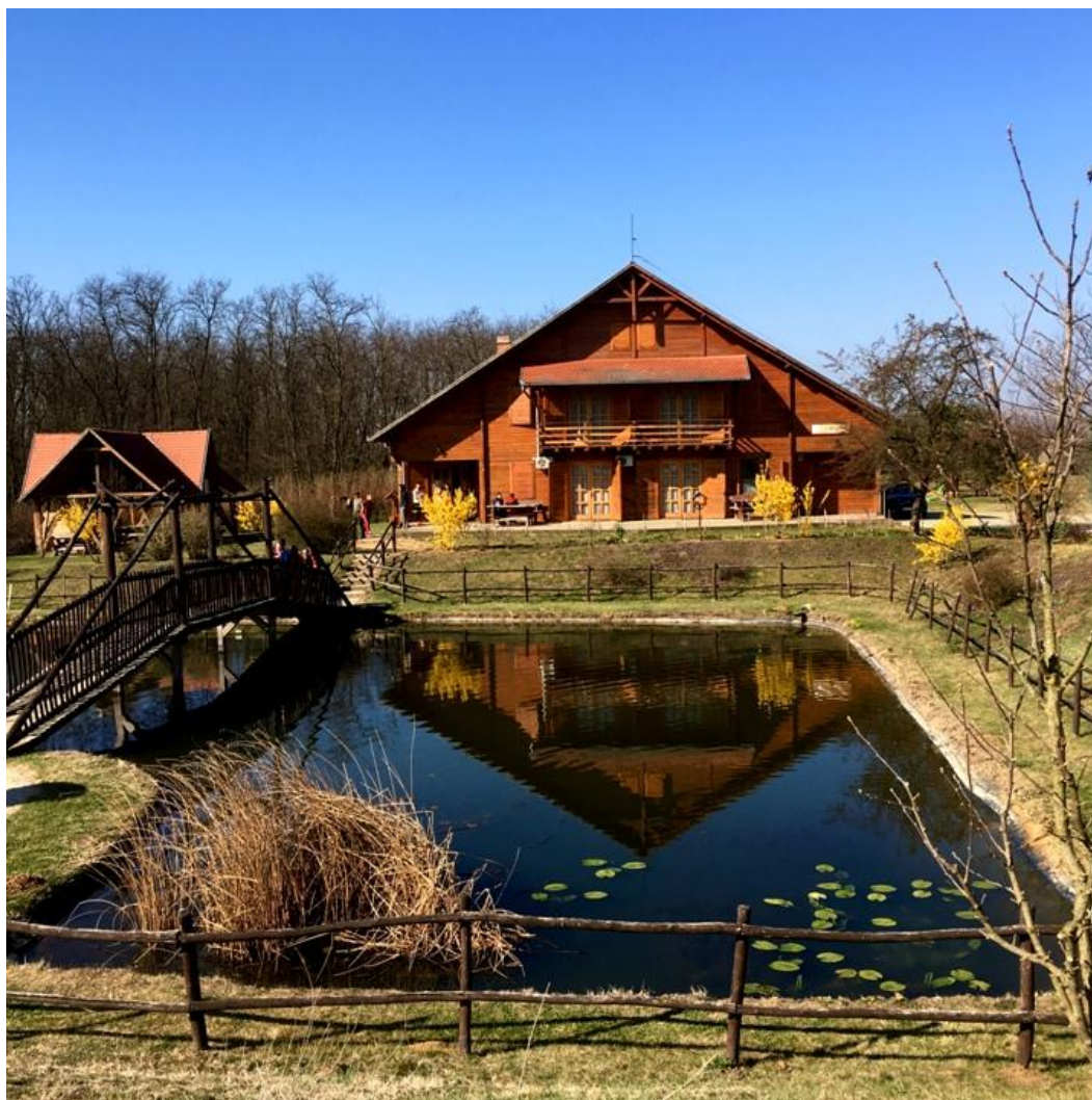
1. kép A kiemelkedő infrastruktúrával rendelkező Harangodi Erdészeti Erdei Iskola a Nyíregyházi Egyetem egyik legfontosabb partnere az erdei iskolai nevelésben.