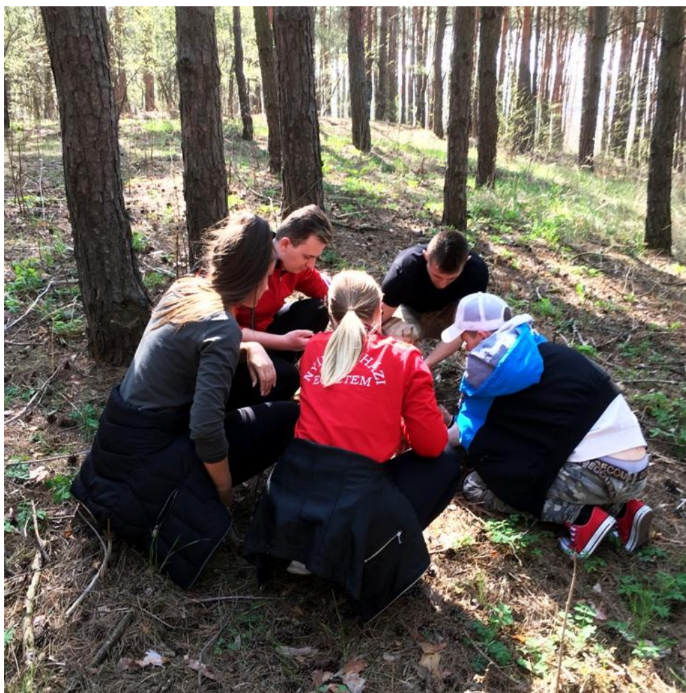
3. kép Játékos gyakorlatok elsajátítása a szabadban, amelyet gyakorló tanárként a gyerekeknek is átadhatnak.