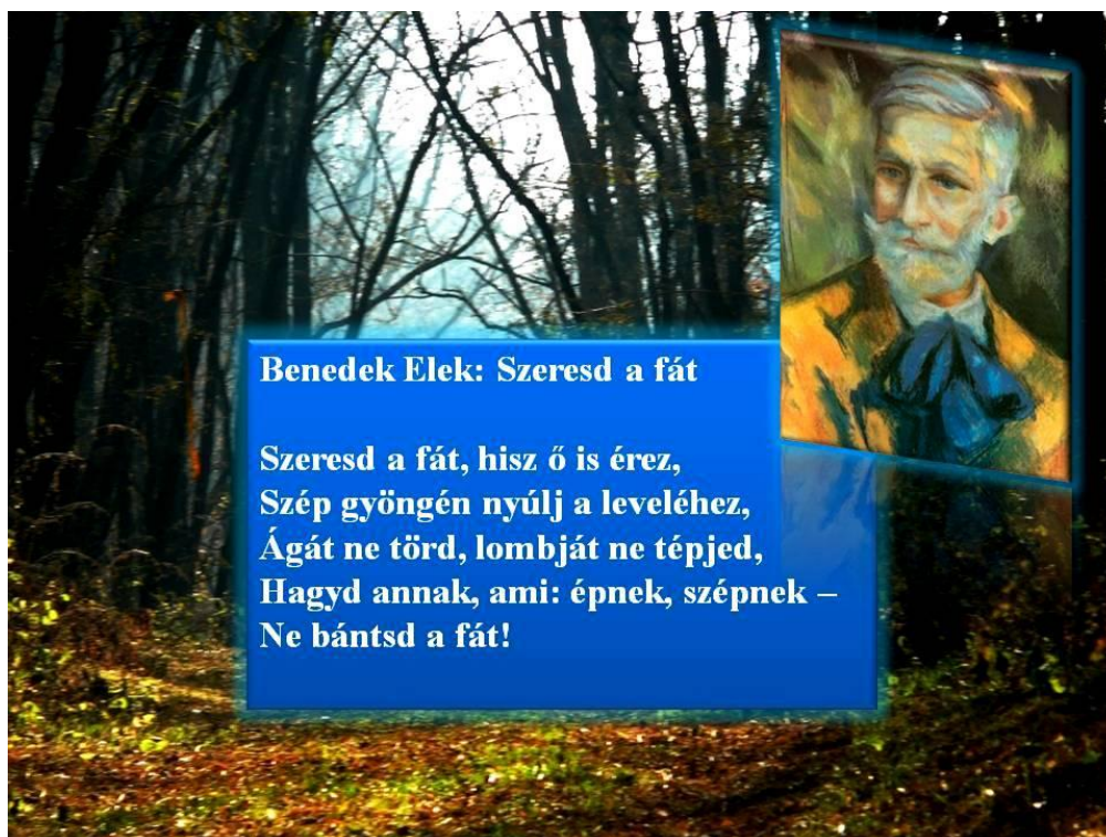
2. kép Részlet az erdei iskolai gyakorlatra felkészítő szemináriumból.

A természettudományok a természetet vizsgálják sajátos módszereikkel. A természettudományos ismeretszerzésnek megfelelően a közoktatásban is tantárgyakon keresztül mutatjuk be a tanulóknak a természet felépítését és törvényszerűségeit. Azonban a természet nem fizikai, kémiai, geológiai és biológiai külön-külön, hanem egy komplex,