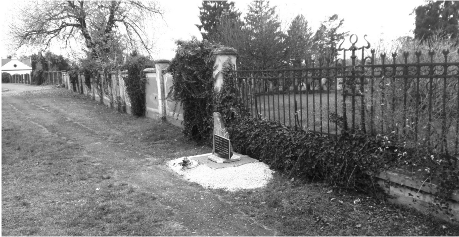
3. kép A kivégzett Jehova tanúinak emlékhelye Körömden

2020. november 4.