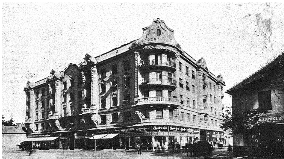
2. kép A Szent Anna és a Batthyány utca sarkán álló négyemeletes bérpalota a Varga utca és a Szent Anna utca sarkáról nézve

Forrás: Z-i L-s [Zoltai L.] : Az épülő Debrecen i. m. 109.