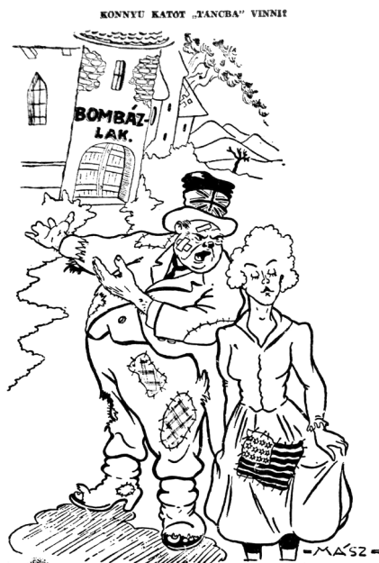
Churchill: „Kicsikém ne tétovázz...”