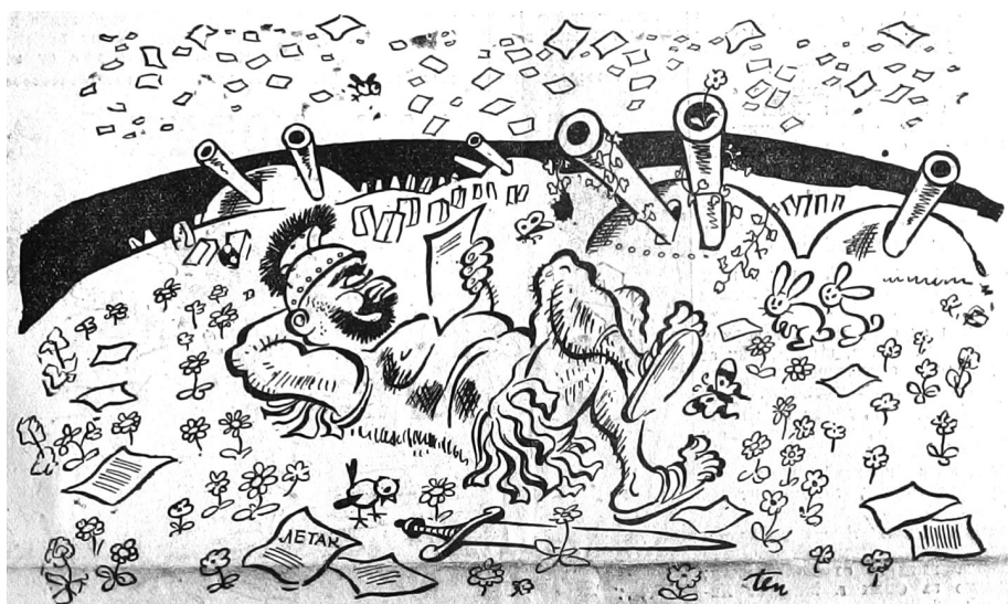
1. kép „A háború első hónapja a nyugati fronton”

és női tagjai eltérők lehettek a rajzokon, felbukkant Franklin D. Rooseveltt amerikai elnök és Winston Churchill brit miniszterelnök, de „a zsidóság” is lehetett a kigúnyolt nász egyik résztvevője. 33 A Magyarság a vérszomjas Marsot ábrázolta, összekapcsolva jelenlétét és pusztítását a „zsidósághoz köthető pénzzel, nyereséggel, háborúból származó profittal.” A Kladderadatsch -ban tovább gondolták ezt a motívumot, s egy torzrajzon a „zsidó attribútumokkal” rendelkező háborúisten borítja lángba az egész Földet. Mars legutolsó alkalommal halálként látható min-két lapban. 34