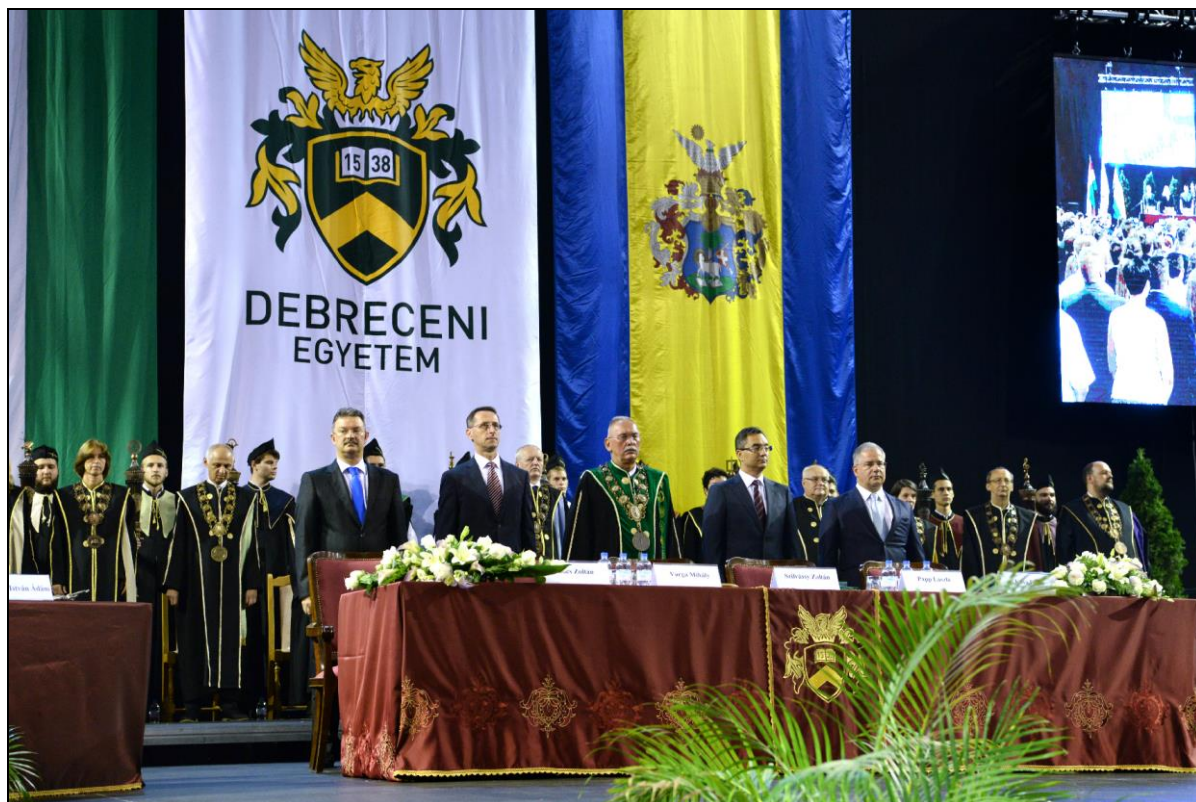
9. kép Tanévnyitó ünnepély 2019. IX. 8-án 15