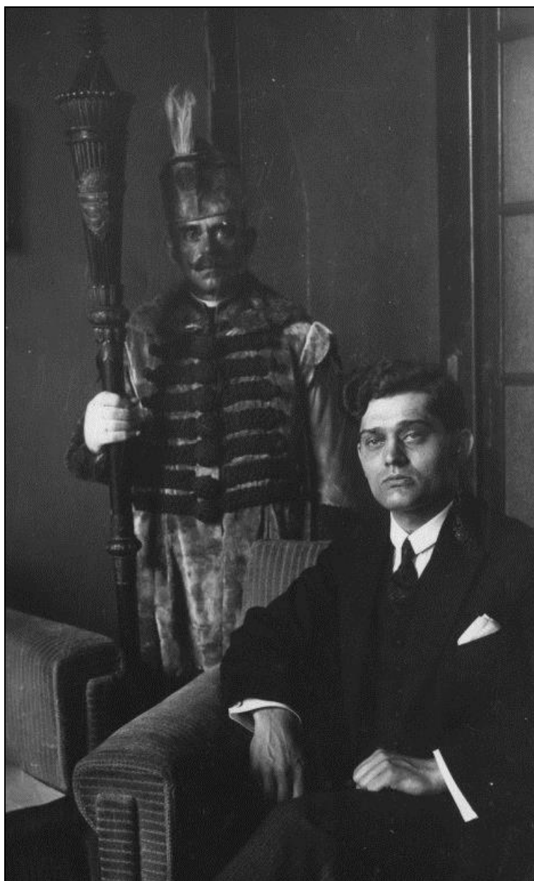
4. kép Az 1929. X. 14-én megrendezett tanévnnyitó ünnepélyen is szerepeltek a Debreceni Egyetem fő jelképeinek számító gerundiumok 9

Részletesen leírta elképzeléseit a gerundium-díszekkel kapcsolatban is, hangsúlyozva, hogy az intézményt a magyar állam létesítette és tartja fenn a város támogatásával, olyan nemes tradíciók átvételével, mint az ősi református kollégium hagyományai. A rektor elképzelései alapján valósult meg az egyetemet jelképező gerundium, tetején a Debrecen város címerét idéző zászlót tartó báránnyal.