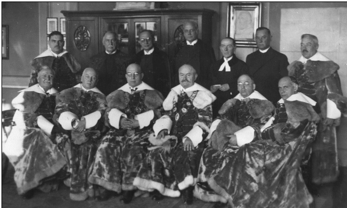
2. kép Az Egyetemi Tanács 1929. XII. 15-én 5