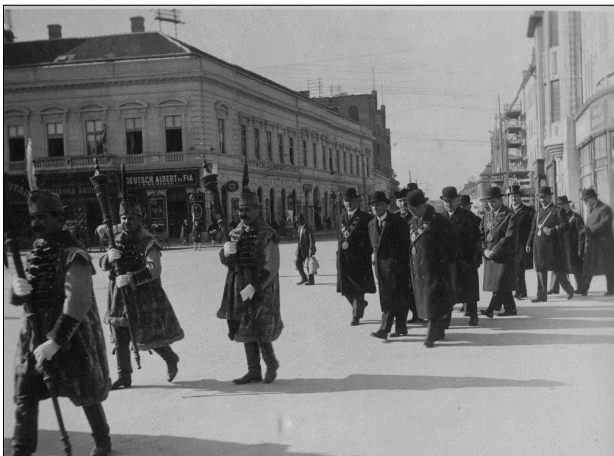
8. kép Tanévnyitó ünnepély 1930. X. 9-én 14

A jelképek száma mára jelentősen kibővült, hiszen a Debreceni Egyetemen 14 kar működik, valamennyi saját gerundiummal rendelkezik, azonban az újonnan készült dékáni láncok is teljesen megegyeznek az eredetivel, kiegészülve a kari színekkel, amelyeket mind a dékánok, mind pedig a diákok viselnek talárjukon. 13 Az ünnepségeken pedig ma is hármat koppant a bárányos gerundiummal a botos diák, és elhangzik a több mint egy évszázada használatos mondat: „ Kérem, álljanak fel, az egyetem vezetése bevonul... ”