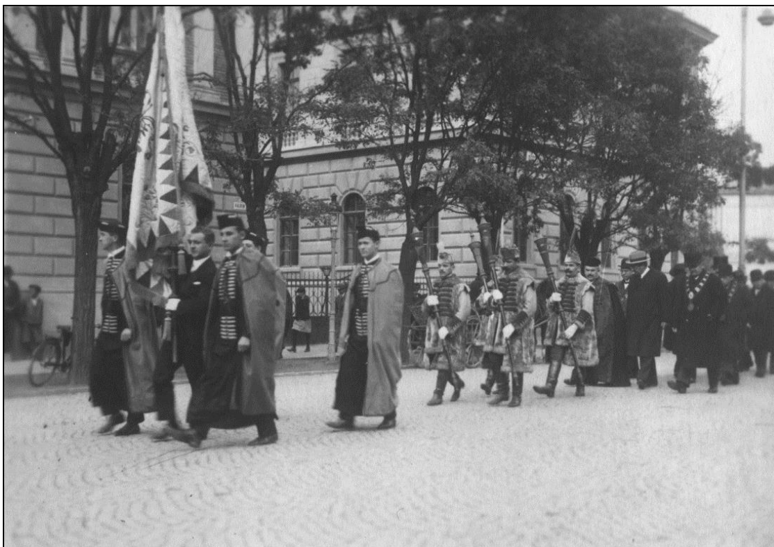
7. kép Kivonulás a Nagytemplomból. 1929. X. 14. 12