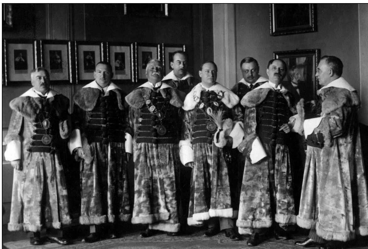
1. kép Az Egyetemi Tanács 1927-1928-ban 2

Felejthetetlen látvány a Debreceni Egyetem ünnepi alkalmain a talárba öltözött, gerundiumot vivő diákok mögött ugyancsak talárt és rektori, dékáni láncot viselő egyetemi méltóságok bevonulása. A máig használt jelképek története csaknem egyidős az intézménnyel. Azt azonban kevesen tudják, hogy a karokat jelképező gerundium csúcspdíszek, valamint a rektori, dékáni láncok és medálok több mint 100 esztendeje készültek az első világháborúban hadizsákmányként szerzett ágyúk bronzából, emlékeztetve arra, hogy az egyetem több hallgatója és oktatója is harcolt a haza védelmében és áldozta életét. 1