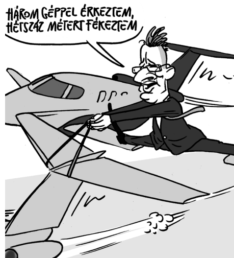
Illusztráció: Pépai Gábor – Népszava