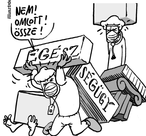
Illusztráció: Pappai Gábor – Népszava