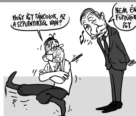
Illusztráció: Pápai Gábor – Népszava

A külügyminisztérium legutóbbi táblázata szerint jelenleg nyolc ország van, ahová a magyar védettségi igazolvánnyal be lehet utazni: Bahrein, Cseh Köztársaság, Észak-Macedón Köztársaság, Hor-