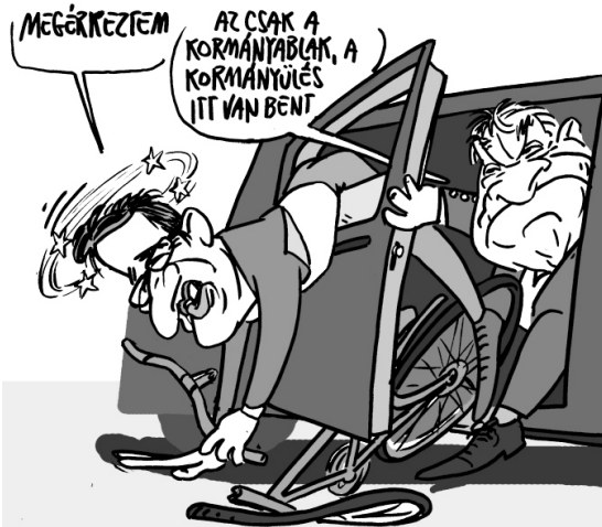
Illusztráció: Pápai Gábor – Népszava

Az elmúlt napokban számos olyan törvényjavaslatot nyújtott be a Fidesz a magyar parlament elé, amelyek korlátozni fogják az önkormányzatok mozgásterét.