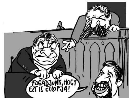
Illusztráció: Pápai Gábor – Népszava

A miniszterelnök családjából ketten is felkerültek a Forbes magazin 100-as toplistájára, amin a legértékesebb magyar tulajdonú cégeket vették számba. Az egyik „szerencsés” vállalkozó Orbán veje, Tiborcz István a BDPST Zrt. nevű ingatlanos cégével. A másik pedig a miniszterelnök apja, Orbán Győző a Dolomit Kőbányászati Kft.-vel.