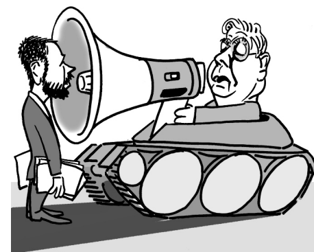
Illusztráció: Pápai Gábor – Népszava

A kampány durvulását mutatta az is, hogy Tarlós István jelenlegi főpolgármester egy megafonnal a kezében „ordította le” azt az ellenzéki képviselőt, Tordai Benecét, aki egy levelet akart átadni neki. Ebben arra szólítják fel Tarlóst, már többed-