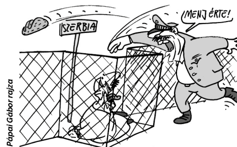
Pápai Gábor rajza

A jogvédők ebben az esetben is a strasbourgi bírósághoz fordulnak, amely korábban már kimondta, hogy a magyar állam nem éheztesse a menedékké-