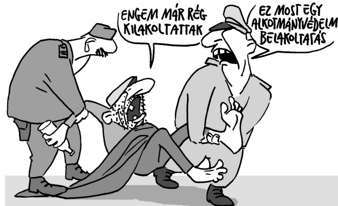
Papai Gábor rajza

Az mindenesetre önmagában is szomorú, hogy az immáron közel egy évtizede kormányon lévő Fidesznek lényegében nincsen más gondolata vagy üzenete az