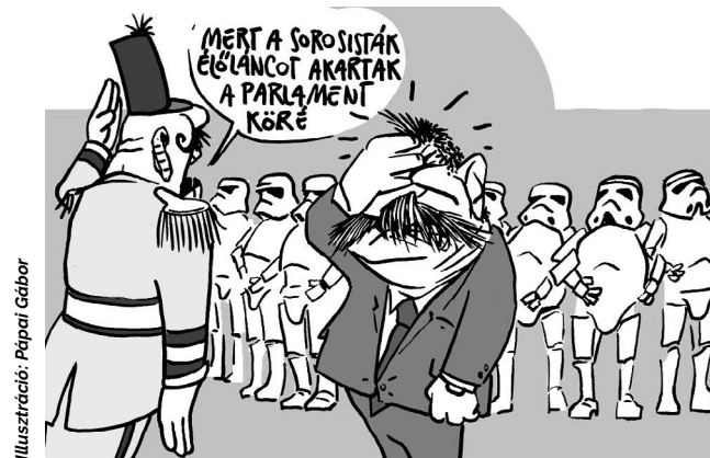
Illusztráció: Pápai Gábor

Két-két és félmillió ember döbbsent rá az utóbbi hetekben, hogy soha nem lesz változás, ha ő maga, személyesen nem tesz érte.