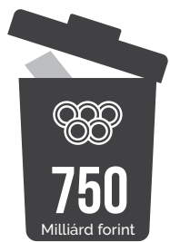
Olimpiai előkészületekre költöttünk 750 milliárdot