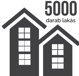
Ebből 5000 bérlakást lehetett volna építeni