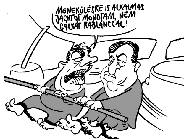
Illusztráció: Pépai Gábor - Népszava