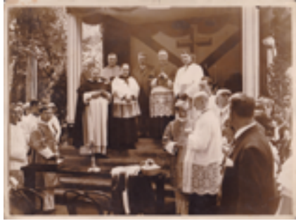
3. kép. Az országos leányzarándoklat alkalmával tartott szentmise Angelo Rotta pápai nuncius részvételével, 1930. május 29. Budapest–Margitsziget

így a rendtagok nem képviselték magukat az eseményen. 33 Az 1926-os az, amikor a margitszigeti zarándoklat időpontja először szeptemberre módosult, majd az iskolai szünet meghosszabbítása miatt el is maradt. 1930-ban nagycsütörtökre (május 29.) esett az időpont, s a Szent Imre-év nagyheti ünneppsorozatának részeként a margitszigeti zarándoklat országos szintű eseménnyé emelkedett (3. kép). Ugyanezen év augusztus 18-án a domonkosok vezetésével Credo-férfiak népes csoportja vett részt a Szabó Szádok tartományfőnök celebrálta ünnepi szentmisén. 34