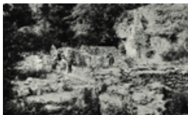
1. kép. A Boldogasszony-templom és rendház romjai, az 1920-as évek.