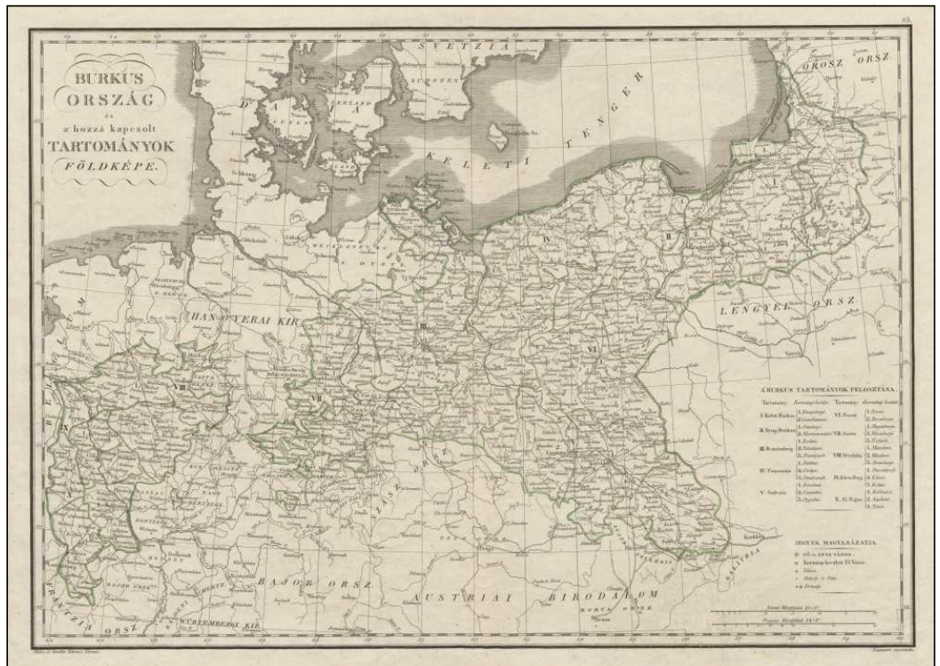
Poroszország 1833, 38x52.1 cm. In. Karacs Ferenc: Európa magyar atlása . 13. sz. lap – OSZK Térképtár, TR 1.544 arch

Valamikor 1796 és 1798 között vizsgatért Pestre. Karacs bízott abban, hogy a fejlődő, az országnak egyre inkább politikai, kereskedelmi és kulturális központjává váló városban kitantult mesterségéből megélhet, képességeit kiteljesítheti, művészi pályát futhat be és nem utolsó sorban családot alapíthat. A Pesten megnyitott térképszerkesztő-rézmetsző műhelye rövidesen ismert és elismert lett itthon és külföldön. A müncheni és pétervári meghívásokat mindvégig elutasította.