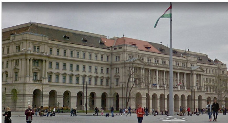
4. ábra. Kossuth tér 11. A minisztérium épületében működött 1967 és 1990 között az OFTH.