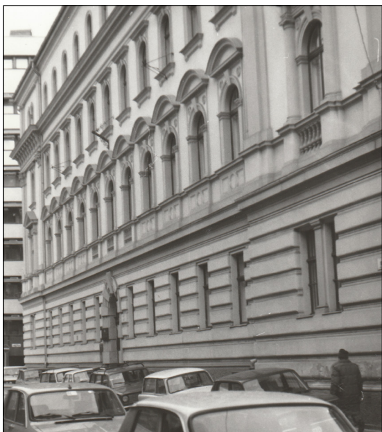
1. ábra. Iskola utca 13. Ebben az épületben működött 1950 és 1953 között az OFI majd az AFTH és a térképtár.