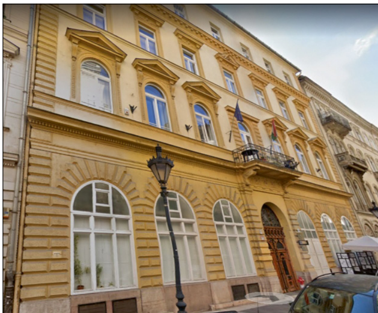
2. ábra. Sas utca 19. (azelőtt Guszev utca) Itt volt 1953 és 1967 között az AFTH majd utána a Pest megyei Földhivatal. Ma Kormányhivatal.