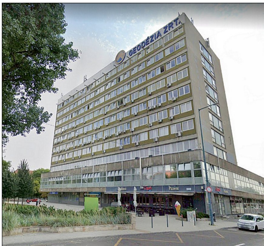
6. ábra. Bosnyák tér 5. Ebben az épületben működött 1969-től a BGTV és a KV, majd 1993-tól 2004-ig a Kartográfiai Vállalat, majd Cartographia Kft., illetve 1991-től a Geodézia Zrt. (Ma Térképész Székház néven a Budapest Főváros Kormányhivatala, a Geodézia Zrt., a Lechner Tudásközpont és a Nemzeti Földügyi Központ szervezeteinek nyújt otthont.)

Hosszú életem során sok mindent láttam, tapasztaltam, illetve sok mindennek a részese voltam. 1944. március 19-én ott álltam az Astoria szálló előtt, és néztem a német katonaság bevonulását Budapestre. Október 15-én hallgattam a rádióban a Horthy-proklamációt, miszerint Magyarország kilép a háborúból. Sajnos nem ez történt. 1945