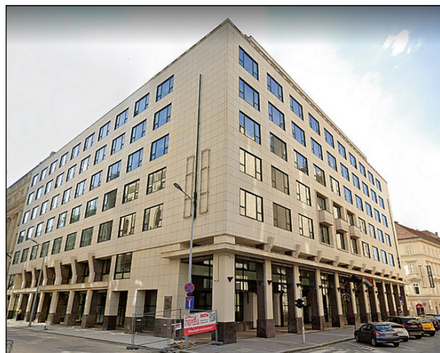
5. ábra. Vigadó tér 1. Ebben az épületben működött 1950 és 1993 között az UVATERV 60 fős Geodéziai osztálya.