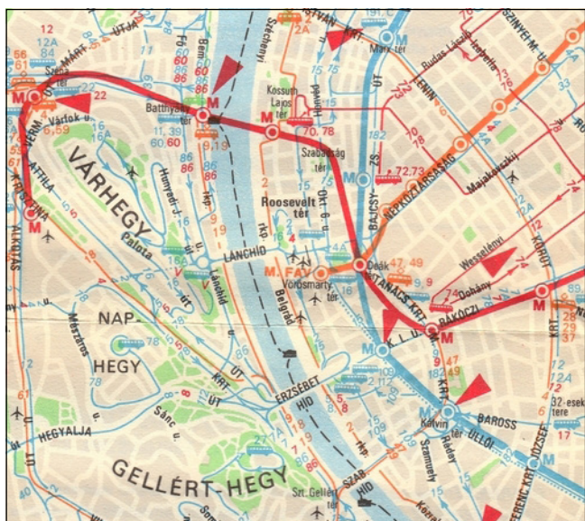
Budapest közlekedési hálózata 1981-ben

Gyűjteményem utolsó térképe az 1996-ban megjelent Budapest városatlasz. A kiadvány B/5-ös méretű, puha fedelű, spirálozott, 178 oldal terjedelmű könyv,