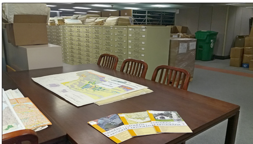
A Geodézia és Kartográfia számai az amerikai nemzeti térképész szolgálat (USGS–United States Geological Survey) könyvtárában.

A megnyitó ünnepség feszes tempójú volt: viszonylag kevés és rövid beszéd, a kulturális programot egy egyetemi gospel kórus adta, mely viszonylag rövid (csak három dalból álló) fellépése alatt sikerült jó hangulatot teremteni a megnyitó ünnepség résztvevő között. (2. kép) Érdekes megemlíteni, hogy a kórus az ünnepséget a 2015-ös riói konferenciánkra komponált ICA himnusz eléneklésével kezdte, amihez a közönség közreműködését is kérték. Érdekes színfoltként az ICA bizottságok vezetői, képviselői kaptak nagyon rövid bemutatkozási lehetőséget a nyitóünnepségen,