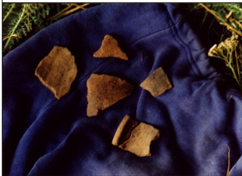
3. ábra Az 1999. évi 2. szelvényben talált kora Árpád-kori edénytöredékek