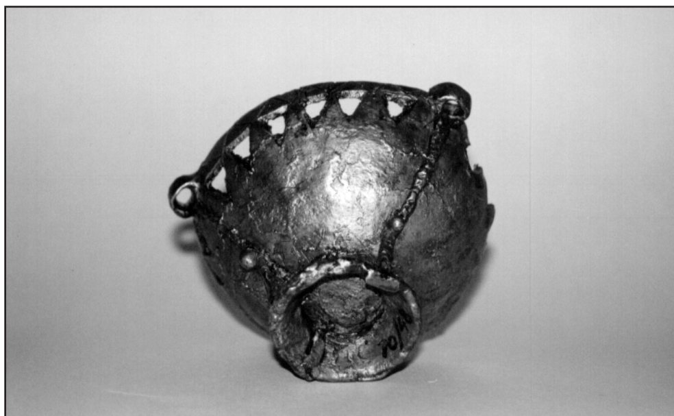
2. ábra A Székelyudvarhely – „Budvár”-i bronz füstölőalj alulnézeti képe