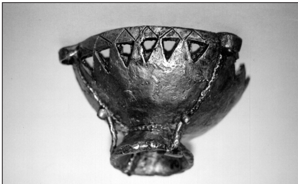
3. ábra A Székelyudvarhely – „Budvár”-i bronz füstölőalj oldalnézeti képe