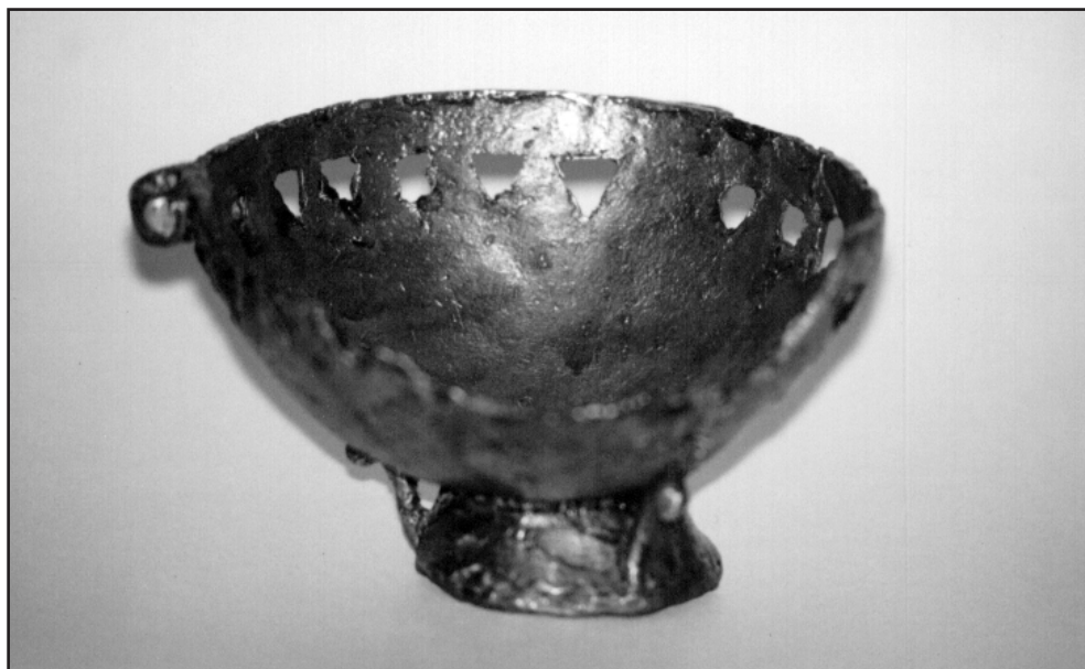
1. ábra A Székelyudvarhely – „Budvár”-i bronz füstölőalj felülnézeti képe (ZEPECZÁNER Jenő felvétele. Szívességét ezúton is köszönöm F.G.)