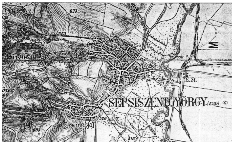
3. ábra A K.u.K. Katonai Földrajzi Intézet 1914-es térképe 22/XXXIII lapjának részlete, kétszeres nagyításban (~1:32500)