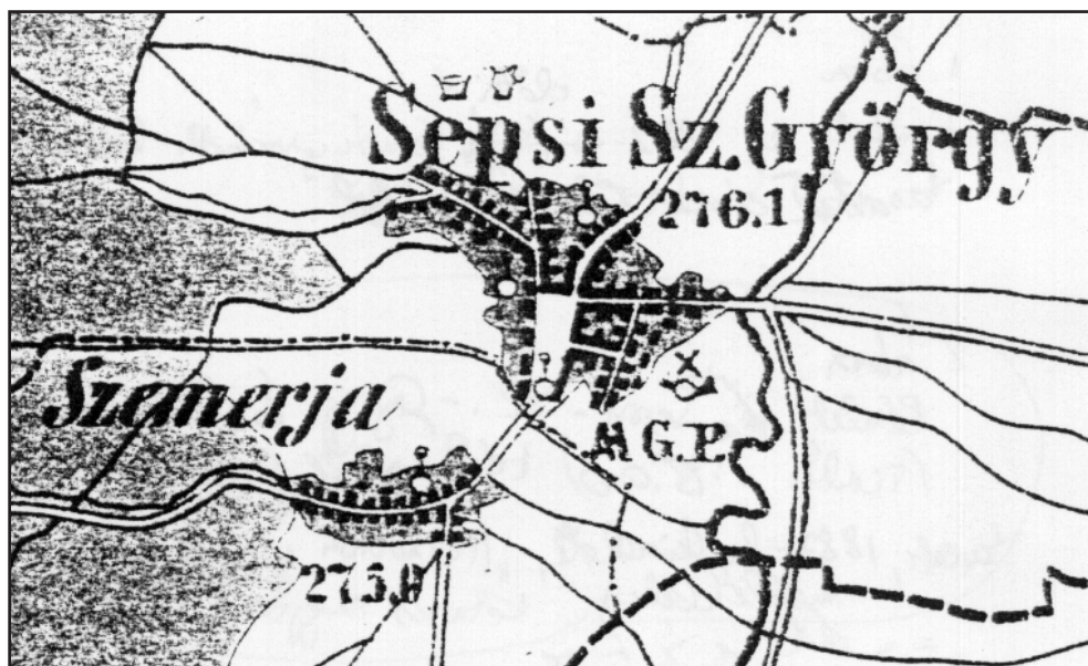
1. ábra Részlet az 1870-es évek első felében készült, Erdély törvényszéki kerületi beosztását ábrázoló térképről