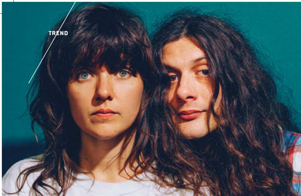
/ COURTNEY BARNETT AND KURT VILE