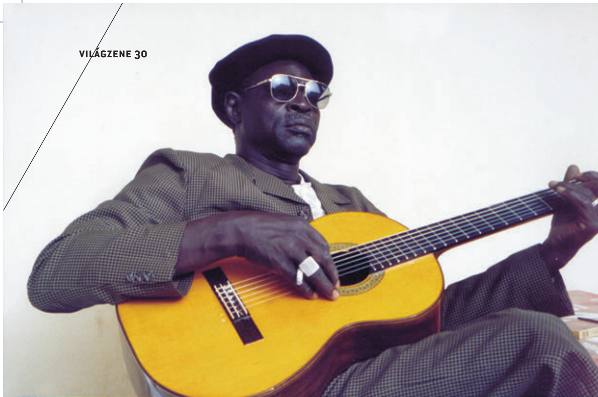
/ALI FARKA TOURE