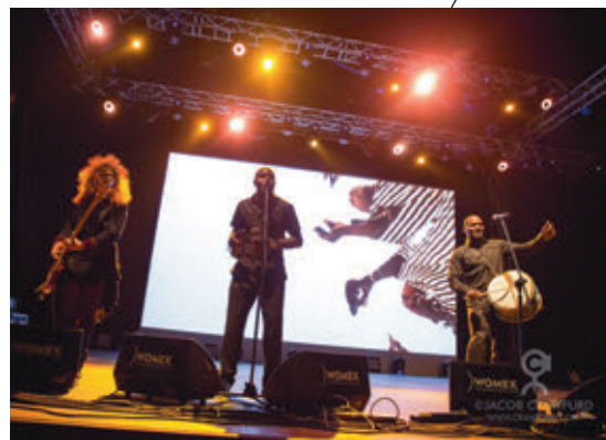
/ FRIEDRYKA ELECTRIQUE

Persze az, hogy a világzene megjelent és viszonylag gyorsan kibokszolta a maga helyét