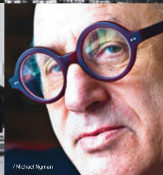
/ Michael Nyman

a klasszikus zene kölcsönhatása a huszonegyedik századra sem szorult vissza, a Samuel Barber-vonósnégyest feldolgozó, kétezres évek eleji Adagio For Strings Tiëstőtől, aztán Lady Gaga Bachot beépítő Bad Romance -e vagy a Clean Bandit folyamatos elektroklasszikus törekvései mellett is gyakran talál egymásra a két világ.