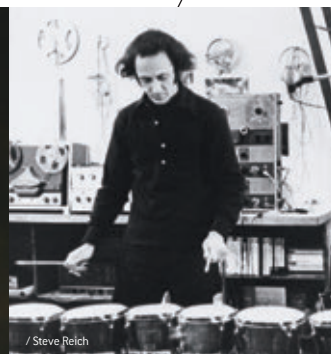
/ Steve Reich