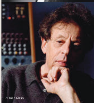
/ Philip Glass