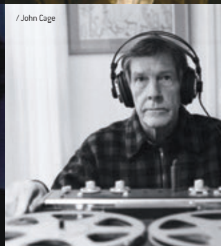
/ John Cage