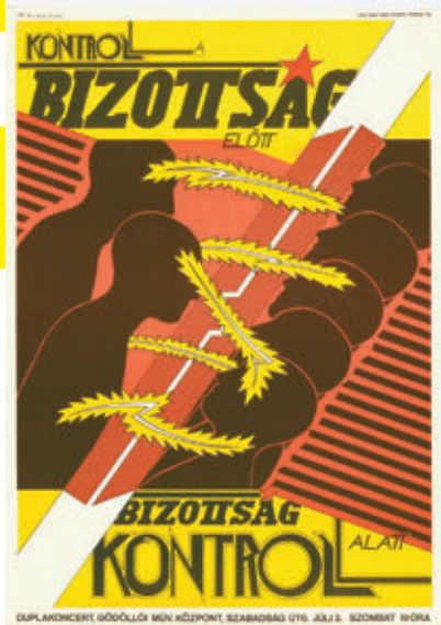
/TÉRY: VÁHORN ANDRÁS