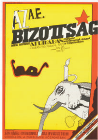
/TÉRY: WAHORN ANDRÁS