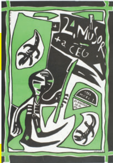
/TÉRY: GERÉNY GÁBOR