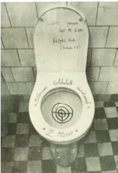
/TÉRY: KELENTI GÁBOR