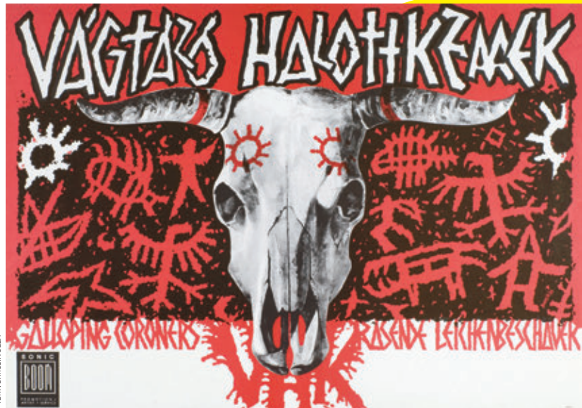
/TÉRY: BARKSIS GÉZA