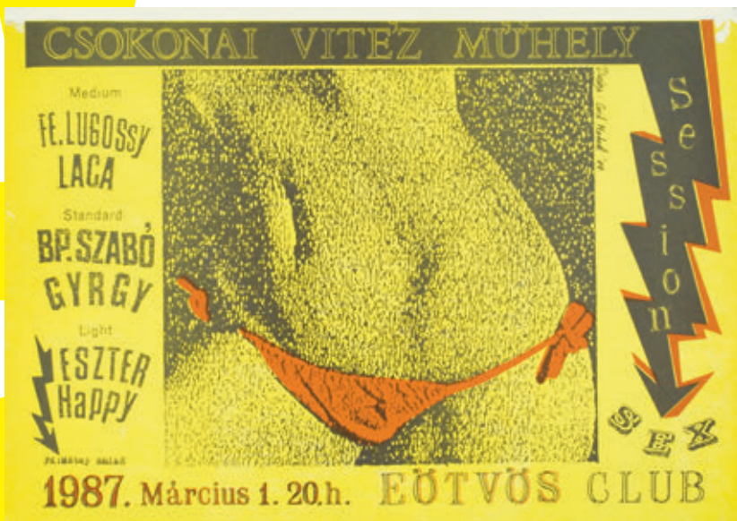
/A FENTI NÉGY PLAKÁT A KÖNYVBEN NEM SZEREPEL