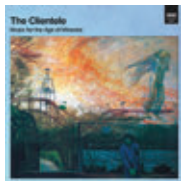
THE CLIENTELE Music For The Age Of Miracles [Merge, 2017] ŐSZI INDIEROCK