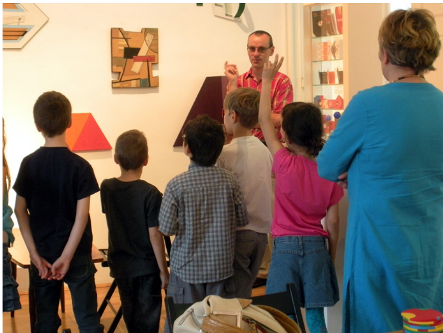
Múzeumpedagógiai foglalkozás a MADI kiállításban, I.