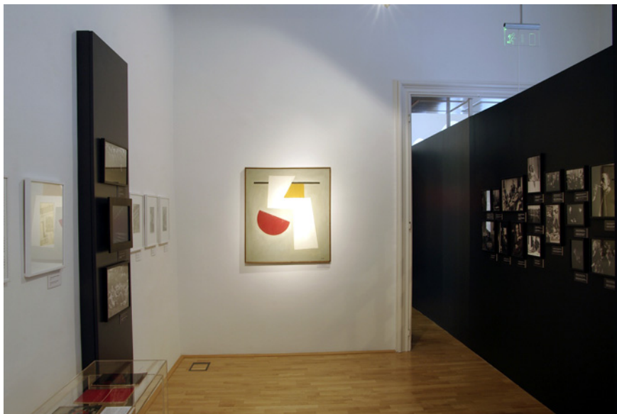
Az állandó kiállítás részlete, IV.