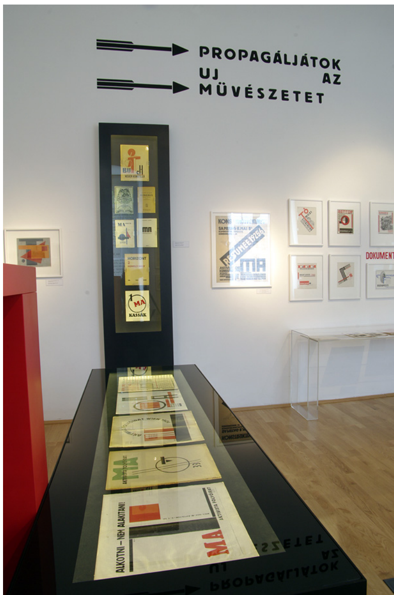
Az állandó kiállítás részlete, V.