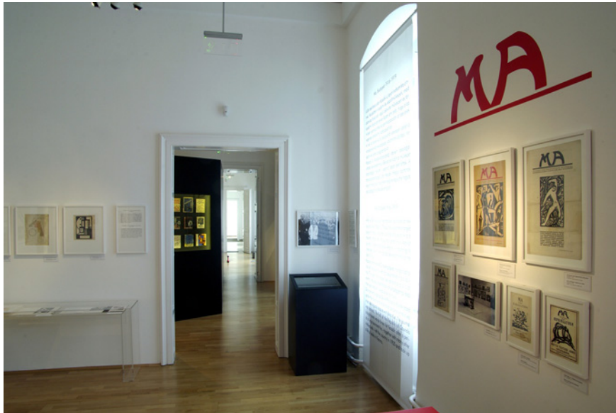
Az állandó kiállítás részlete, III.