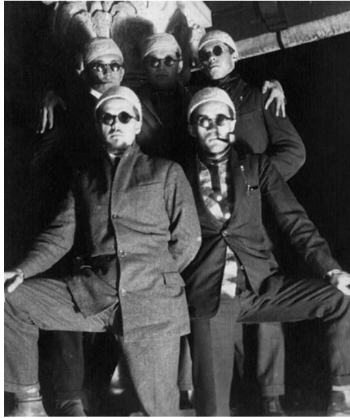
A Traveleri művészcsoporthoz tartozók A kölcsönös batások körei című kiállításon, 2011.