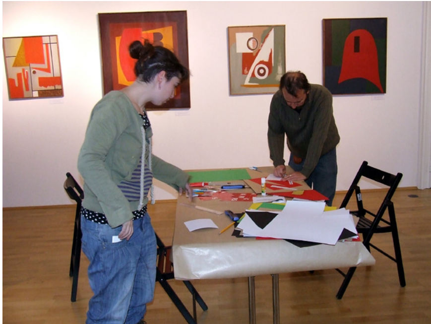
Múzeumpedagógiai foglalkozás a Kassák Múzeumban, II.