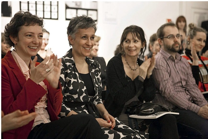
A Múzeumcafé Díj átadása a Kassák Múzeumban, 2013. március.