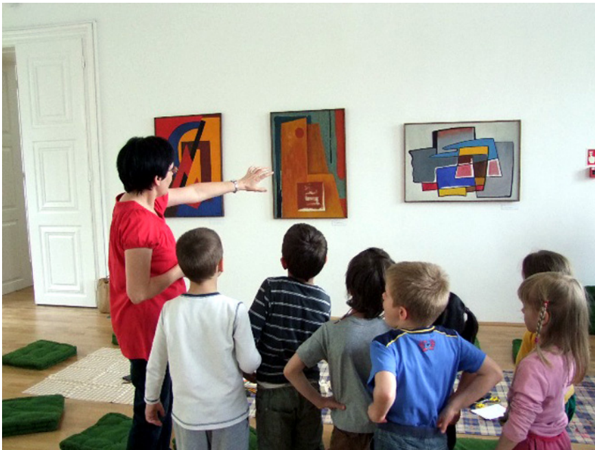
Múzeumpedagógiai foglalkozás a Kassák Múzeumban, I.