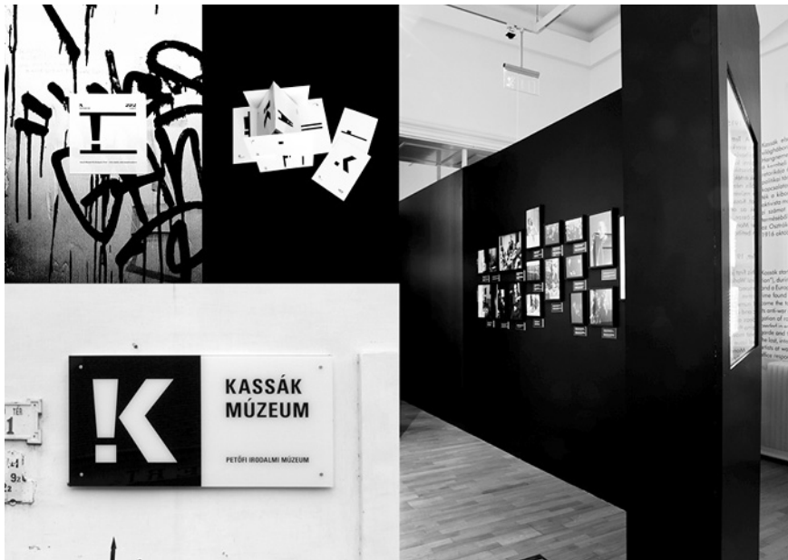
A red dot és a GOOD DESIGN pályázatokra beadott összeállítás, III. (Tervező: Lepsényi Imre)