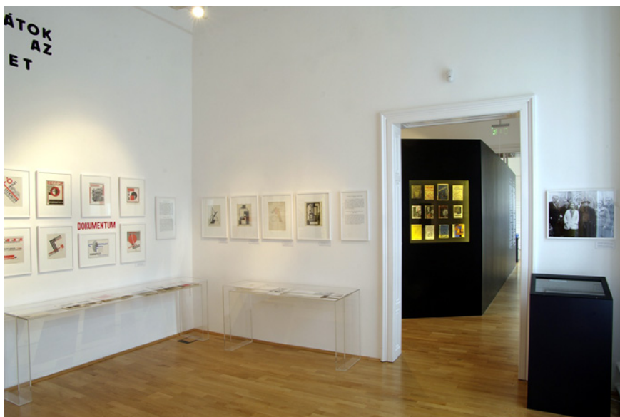
Az állandó kiállítás részlete, II.