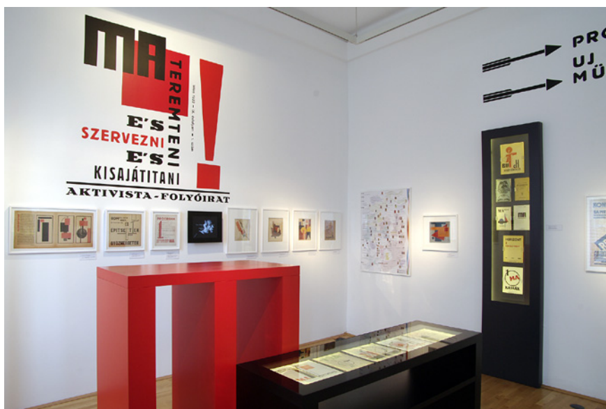
Az állandó kiállítás részlete, I.