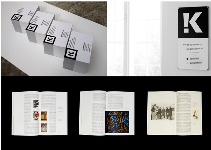
A red dot és a GOOD DESIGN pályázatokra beadott összeállítás, I. (Tervező: Lepsényi Imre)