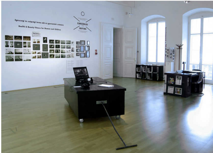
Az Elmozdulás. Munkáskultúra és életmódreform a Magyar-iskolában című kiállítás részlete, 2011