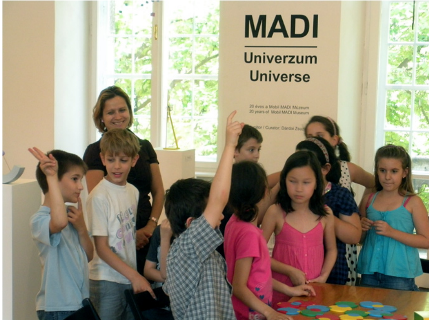
Múzeumpedagógiai foglalkozás a MADI kiállításban, II.