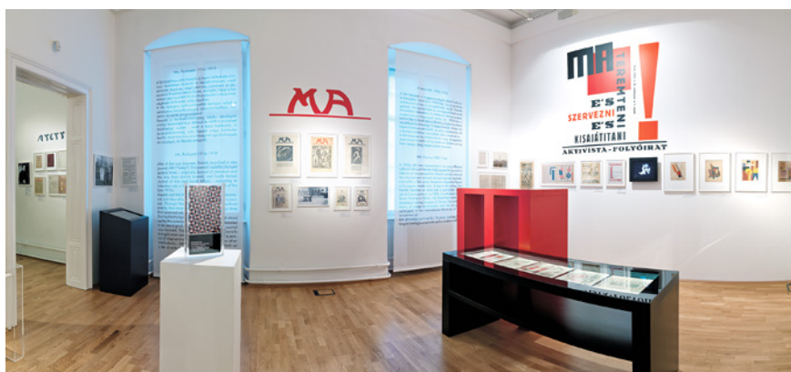
Az állandó kiállítás a Múzeumcafé magazin díjával