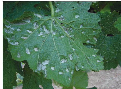
Szőlő-gubacsatka kárképe a levél fonákán

Előfordulhat, hogy a területen a ragadozó atkák populációja jól kordában tudja tartani a károsítók szintjét, de ehhez szükség van ked-