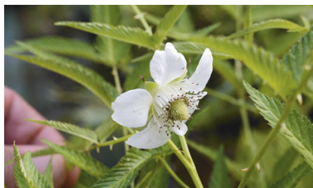
Virágai magányosan fejlődnek

Kelet-Ázsia és Japán az őshazája, fagyűrő, lombhullató félcserje. Télen elviseli akár a mínusz 30 °C-ot is, mert a hajtásai ugyan elfagynak, de a következő évben újra kihajt. Teljesen kifejlődve 60-100 cm magas, elterülő növekedésű, tüskés bokrot alkot, és