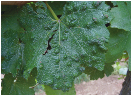
A levél színén dudorok alakulhatnak ki a szőlő-gubacsatka kártételétől

A károsítás hatására a levelek kanalasan zsugorodnak, azaz a levél színe felé hajlanak. A