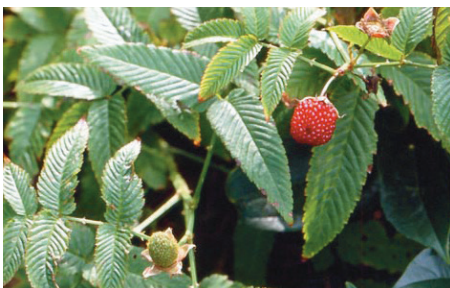
Keskeny, lándzsás levélkéi vannak

talajtakarónak is ajánlják, mert ahol jól érzi magát, szépen terjeszkedik a kertben. Erős, szerteágazó gyökérzete van, ezért lejtők megfogsására is használják. Talajban nem válogatós, sem a kötöttséget, sem a kémhatást tekintve, de gondoskodni kell a megfelelő vízelvezetéséről, akkor kötött talajban is megél. Hűvösebb klímán júliusban kezd virágozni, és augusztus-