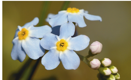
Kedves, halványkék virágokat ont a mocsári nefelejcs

A mocsári nőszirm ( Iris pseudacorus ) napos és félárnyékos helyen, kötött, sok szerves anyagot tartalmazó talajban érzi jól magát, ott erőteljesen terjeszkedik is erős rizómáival. Kékeszöld kardlevelei egyméteresek is lehetnek. Egy-egy virágszáron több sárga, barnaerezettel tarkított virág nyílik május-júniusban.