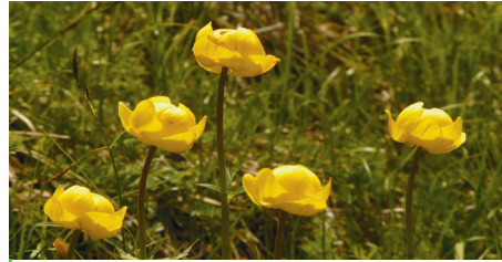
A nálunk is honos zergeboglár kerti változatait könnyebben nevelhetjük otthon

kertészeti árudákban. A vad fajnál erősebb növekedésűek, 50-80 cm magasak, inkább bokros, buja megjelenésűek. A boglárkafélék mérgező növények, de keserűanyagaik általában mindenkit elriasztanak maguktól. Fajtatól függően április és július között nyílnak nagy aranysárga vagy narancssárga virágai. Teljes napra, szellős, tágas helyre ültessük, mert nem viseli el a gyökérkonkurenciát.