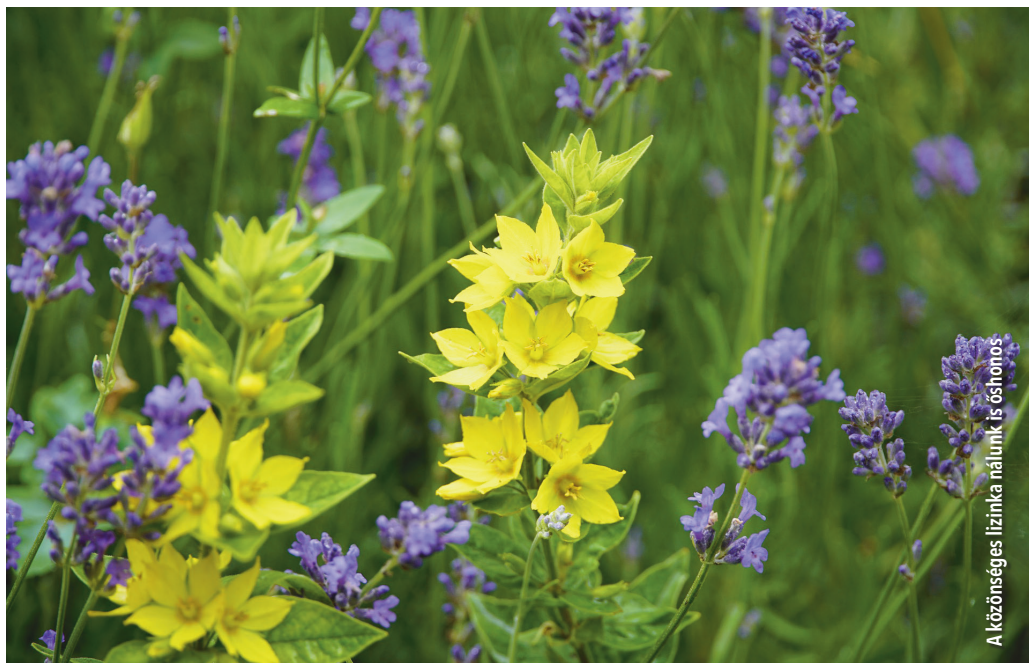
A közösséges lizinka nálunk is őshonos