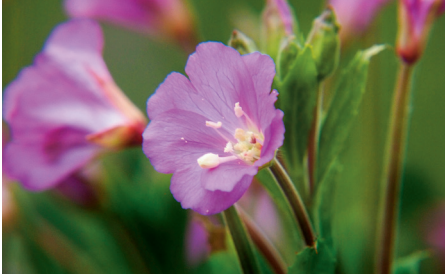
Júniustól nyílnak a borzas fűzike virágai

szórt állásúak. Az egész növényt puha szőrök borítják. A 15-25 mm átmérőjű, négyszirmú virágai élénk bíborszínűek, júniustól szeptember végéig nyílnak. Felnyíló, hosszú toktermésében borzas repítőszőrökkel