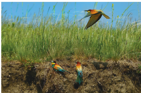
A gyurgyalag május közepén-végén érkezik hazánkba

A madár tudományos neve görög és latin gyökekre vezet vissza. A latin apiastra kifejezés például