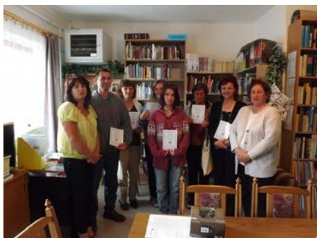
Internethasználati tanfolyam Milejszegen

A növekvő kínálat alapján az olvasói érdeklődés növekedésére számítunk a következő évben. A szolgáltatóhelyek működési körülményeinek javításával (eszközbeszerzések) és az egyre népszerűbb közösségfejlesztő, különböző programok (olvasásfejlesztő, szabadidős programok, foglalkozások, képzések) szervezésével a vidéki lakosság művelődési lehetőségeit kívánjuk javítani. Szeretnénk eleget tenni annak a küldetésünknek, hogy lakóhelytől függetlenül minden településen azonos színvonalú könyvtári szolgáltatásban részesüljön a lakosság.