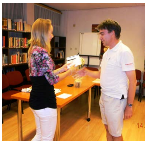
„HIKER”, a verseny nyertese átveszi könyvjutalmát

A játékban résztvevők ajándékban, a helyezettek pedig könyvjutalomban részesültek, amelyet 2014. június 16-án 17 órakor, a ZVMKK Könyvtárban megtartott eredményhirdetésen vehettek át. Folytatás várható, a Guglizz rá! 3. online vetélkedő 2014 őszén veszi kezdetét.