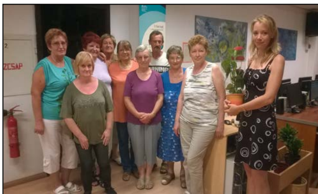
Nyuginet tanfolyam kezdő csoport

A visszajelzések mindkét csoport esetében nagyon pozitívak voltak. Sok új ismerettel gazdagodtak, bátrabban használják a számítógépet. Rendszeresen tartjuk a kapcsolatot e-mailben és a közösségi oldalakon keresztül.