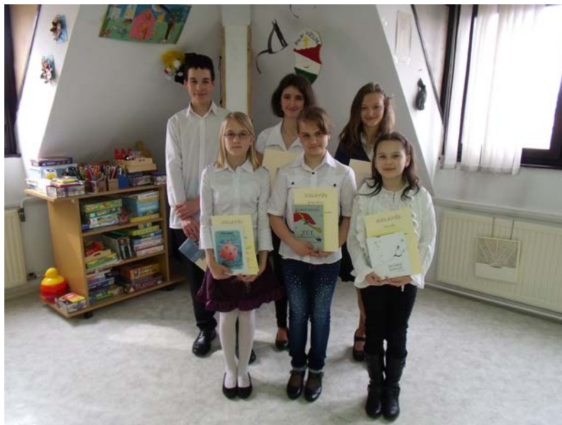
József Attila szavalóverseny 2014. március 24.

„Magamban bíztam eleitől fogva - ha semmije sincs, nem is kerül sokba ez az embernek...”