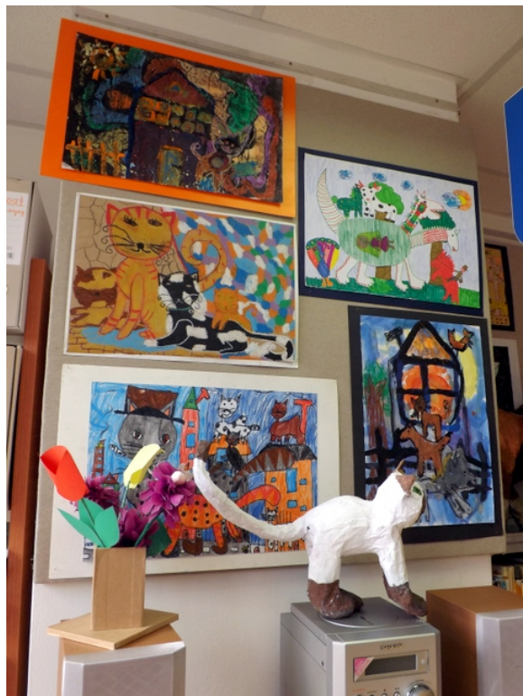
A nagyszerű Színmanók kiállítás részlete

Az Olvasótábori klubban havi rendszerességgel továbbra is találkoznak a gyerekek, ahol az aktuális ünnepekhez mindig barkácsolnak valamit.