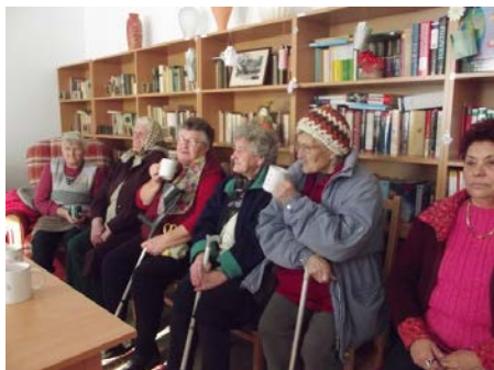
Előadás a gyógynövényekről Mikekarácsonyfán