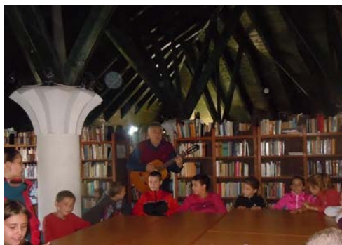
Zenés irodalmi műsor Bakon