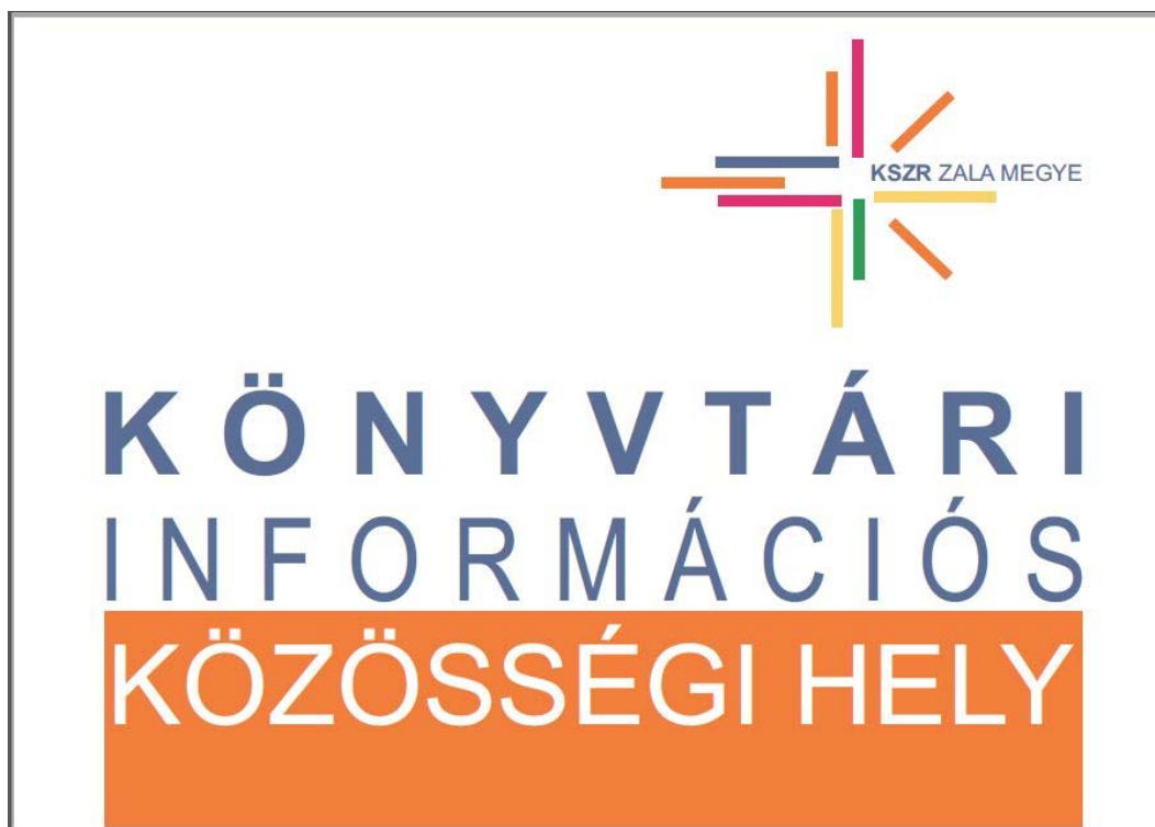
A szolgáltatóhelyekre kihelyezésre kerülő információs tábla