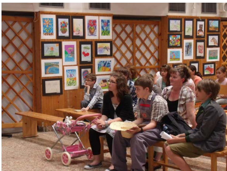
A győztes csapat