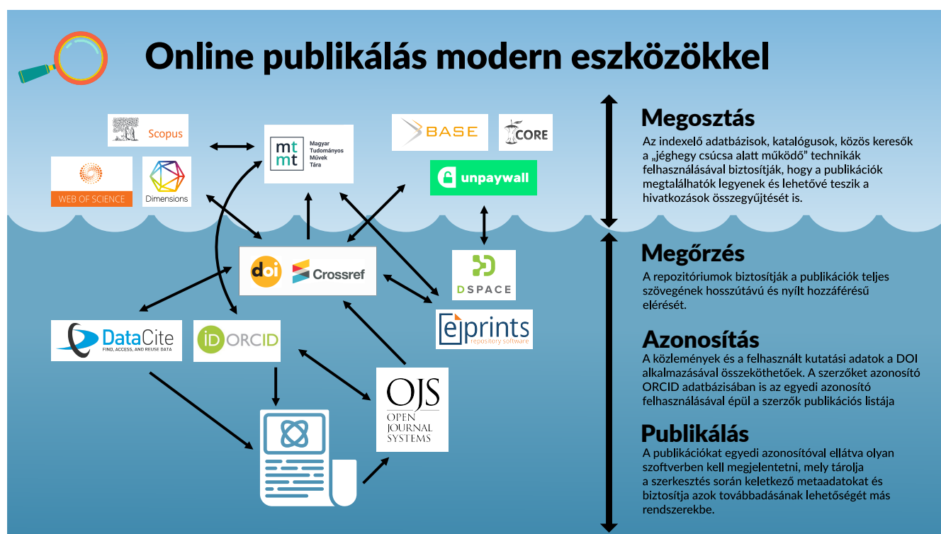
3. ábra. Online publikálás modern eszközökkel

Az OJS-sel kapcsolatban a következő e-mail címen lehet érdeklődni: ojs-help@konyvtar.mta.hu ■