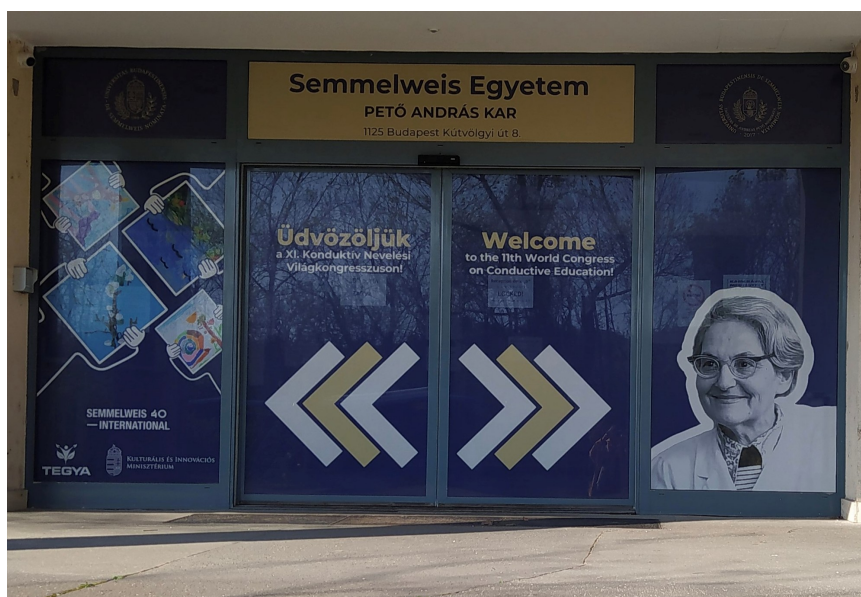
Az SE Hári Mária Kari Könyvtár és Forrásközpont bejárata ma

2007-ben egy HEFOP pályázaton elnyert támogatással ismét megújult a könyvtár. Nagyobb alapterületen, korszerűbb berendezéssel működhetett tovább. Ekkor vette fel Hári Mária nevét. 2017. augusztus 1. óta a Semmelweis Egyetem Pető András Karának szervezeti egységként, Hári Mária Kari Könyvtár és Forrásközpont néven szolgálja Olvasóit és a konduktív pedagógiát.