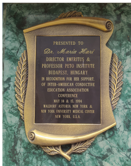
Balra és jobbra: Hári Mária kitüntetéseiből; középen: Diana walesi hercegné 1990-es látogatása során kitüntette Hári Máriát.

és elismertté tétele, valamint a konduktorképzés fejlesztése. Számos nemzetközi konferencián tartott előadást, több nyelven írt tudományos közleményeket, amelyek egyre több szakember érdeklődését keltették fel a konduktív nevelés iránt. Az Intézet és a Pető-módszer bemutatását nagyban elősegítette egy 1986-ban a BBC által készített film. Miután több országban is levetítették, a világ minden tájáról folyamatosan érkeztek a látogatók az Intézetbe, hogy személyesen ismerhessék meg az ott folyó munkát. Számos külföldi család hozta el Budapestre agyi bénulás következté-