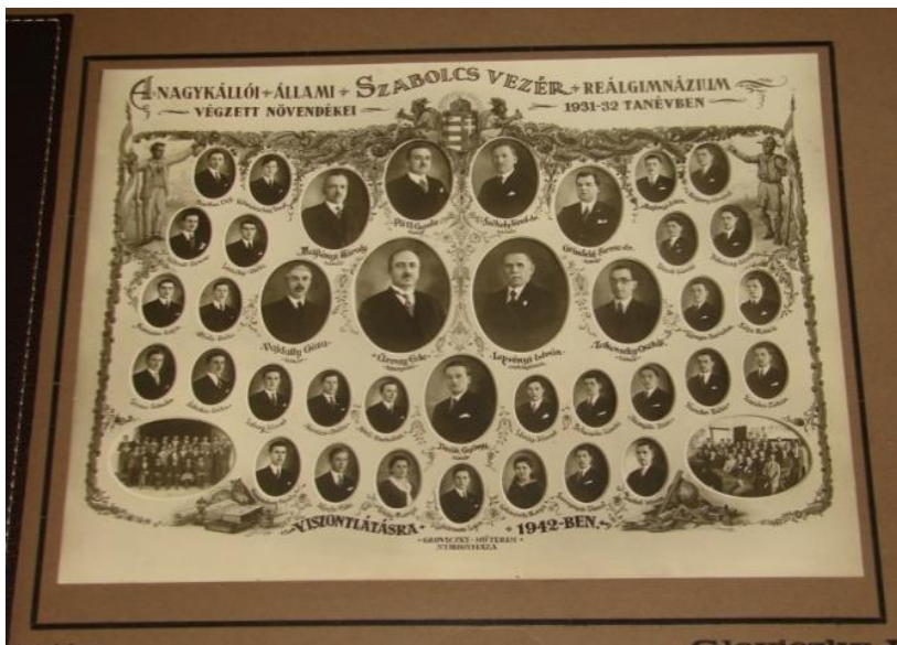
2. ábra Nagykovácsi Állami Szabolcs Vezér Realgimnázium végzett növendékei 1931-32