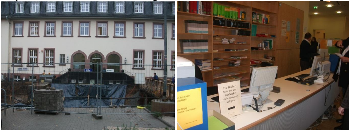
1. A könyvtár kívülről és a kölcsönzőpult

A könyvtárban a Semmelweis Egyetem Központi Könyvtárának munkatársait Hiltraud Krüger főkönyvtáros fogadta a nyitási idő előtt, hogy legyen idő a körbevezetésre, mielőtt megérkeznek a hallgatók. A könyvtár kétszintes épületben helyezkedik el, a földszinten található a kölcsönzőpult, egy kisebb és egy nagyobb olvasóterem a folyóiratok legutóbbi számaival, tankönyvekkel és számítógépekkel, az eggyel lentebbi szinten /pinceszinten/ pedig egy kisebb olvasóterem monografikus művekkel. A Könyvtárban összesen négyen dolgoznak a főkönyvtárossal együtt. A nyitva tartási időben ketten ülnek a kölcsönzőpultban, frekventáltabb időszakban, ha szükséges, többen is. A Könyvtárban nem folyik könyvfeldolgozási munka, azt az Egyetemi Könyvtárban végzik, így a klinikai könyvtárban helyben kölcsönzői és olvasószolgálati feladatokat látnak el az ott dolgozók.