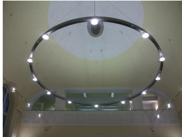
3. Régi kápolna, mostani olvasóterem

Könyvállomány tekintetében a könyvtár 2010 kötettel rendelkezik összesen, melyek főként tankönyvek, de vannak monografikus művek is. A tankönyvek nagy többsége német nyelvű, néhány angol. A Központi Könyvtárban levőkhöz hasonló címekkel és sorozatokkal talákoztunk a könyvespolcokat nézve, úgy, mint a Sobotta atlasz-sorozat vagy a Thieme kiadó könyvei. Egy-egy kötetből több kölcsönözhető példánnyal és két nem kölcsönözhető példánnyal rendelkeznek. A nem kölcsönözhetőeket piros