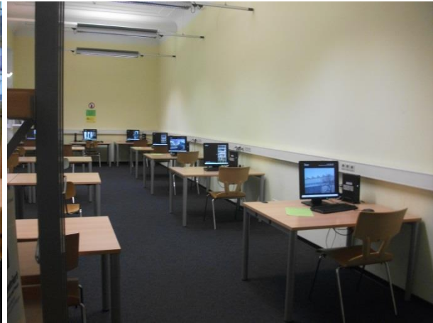
2. Olvasóterem és számítógépes terem