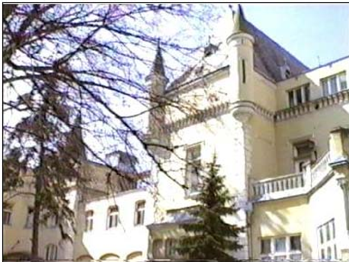
A Törley kastély

a könyvtár. 4 A másik intézmény és könyvtár az Országos Röntgen és Sugárfizikai Intézet (ORSI). Az Országos Társadalombiztosító Intézet (OTI) 1930-ban hozta létre az Országos Sugárfizikai Laboratóriumot (OSL). Feladata a röntgenlaboratóriumok szakmai, szervezési és sugárvédelmi kérdései voltak. 1956-tól – az átszervezést követően – működött ORSI néven 2005. január 31-ig, amikor az Egészségügyi Minisztérium megszüntette. Három munkatársat, a megmaradt műszereket, bútorokat, számítógépeket, könyveket az OSSKI vette át. Tavaly januárban a IV. kerületi Baross utcai fűtetlen, világítás nélküli épületrészben fagyos újjakkal válogattam a dexion salgo állványon porosodó hiányos állomány között.