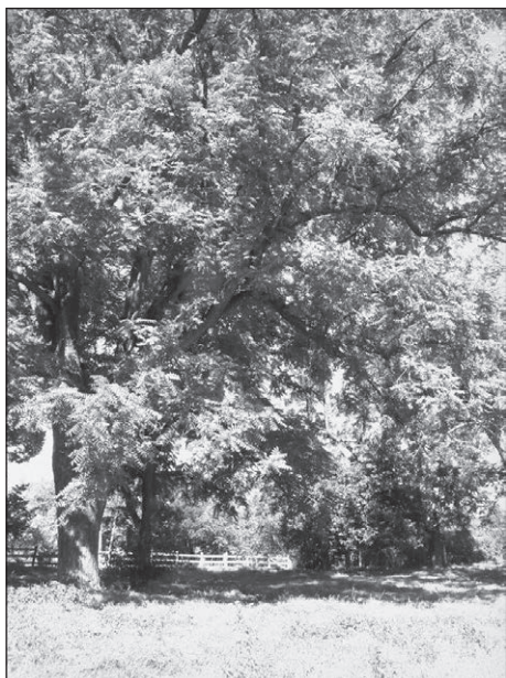
■ Foto 10. Salcâm monumental pe peluza desfășurată la est de castel © Andreea MILEA, 2006 ■ Photo 10. Monumental acacia tree on the manor house's eastern lawn © Andreea MILEA, 2006