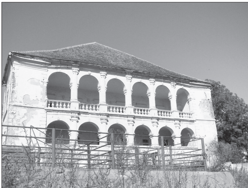
■ Foto 8. Fațada sudică a castelului, cu cele două logii suprapuse, privită de pe țărmul Târnavei Mici