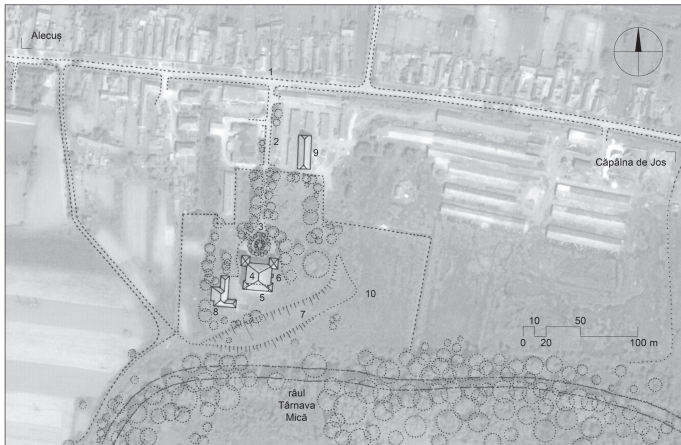
■ Fig. 6. Dispunerea elementelor majore ale ansamblului castelului Bethlen: 1 – acces din drumul satului, 2 – aleea de acces la castel, 3 – rondou plantat, de întoarcere a vehiculelor în dreptul intrării castelului, 4 – castelul Bethlen, 5 – fațada sudică, a logiilor suprapuse, 6 – balcon pe fațada estică, 7 – taluz coborând la nivelul Târnavei Mici, 8 – construcție anexă, 9 – grânarul de secol XIX, 10 – parcul de odinioară (reconstituirea autoarei, suprapusă unei ortofotografii: GoogleEarth 2016; scala grafică reprezentată este estimativă) © Andreea MILEA