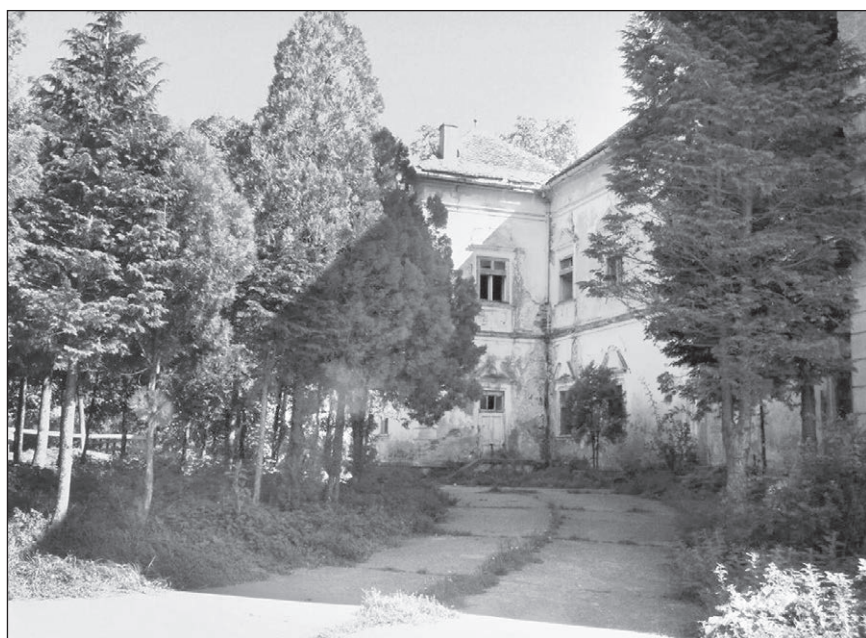
■ Foto 7. Zona de intrare în castel, văzută de pe aleea de acces, după înconjurarea rondoului plantat © Andreea MILEA, 2006