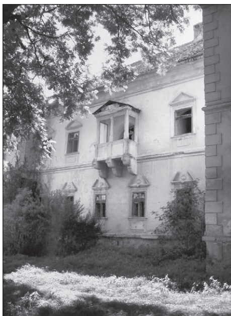
■ Foto 11. Balcon acoperit, la etajul fațadei estice a castelului © Andreea MILEA, 2006 ■ Photo 11. Covered balcony at the upper floor of the manor house's eastern elevation © Andreea MILEA, 2006

A fourth period postcard (Photo 6) shows the manor house and the park seen from the banks of the Târnava Mică River. We notice the free placements, lacking in geometric rigour, of the vegetation: shrubs lining the bank of the Târnava Mică, scattered ornamental specimens on the embankment, somewhat more consistent linings of ornamental shrubs along the manor house's eastern elevation, and, as much as