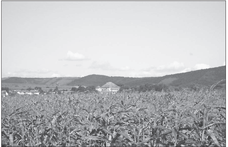
■ Foto 1. Castelul văzut de pe drumul de acces în sat

In 1856, the manor house passed into the ownership of the BRUKENTHAL family, who renovated the building, transforming it into an agricultural school. In 1918 the estate passed in the property of the state, and during the communist regime, the manor house became part of the