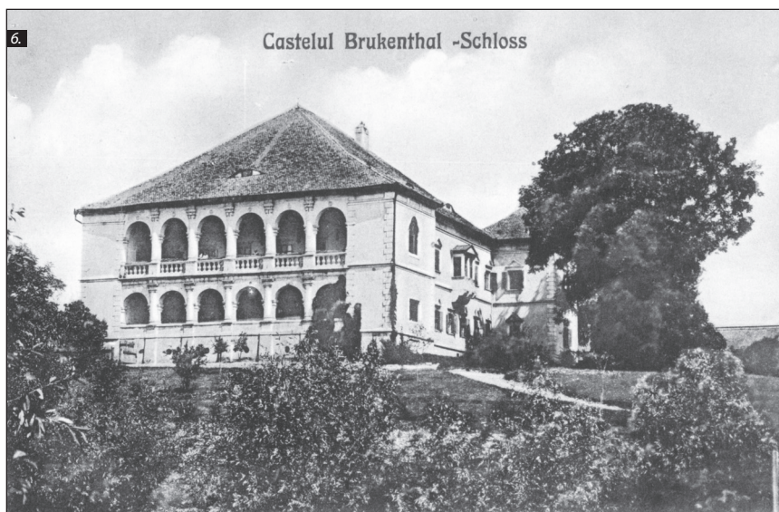
■ Foto 5. Ilustrată de la sfârșitul secolului al XIX-lea, începutul secolului al XX-lea, înfățișând loggia de la etajul laturii sudice a castelului, cu perspectiva deschizându-se amplu asupra văii Târnavei Mici