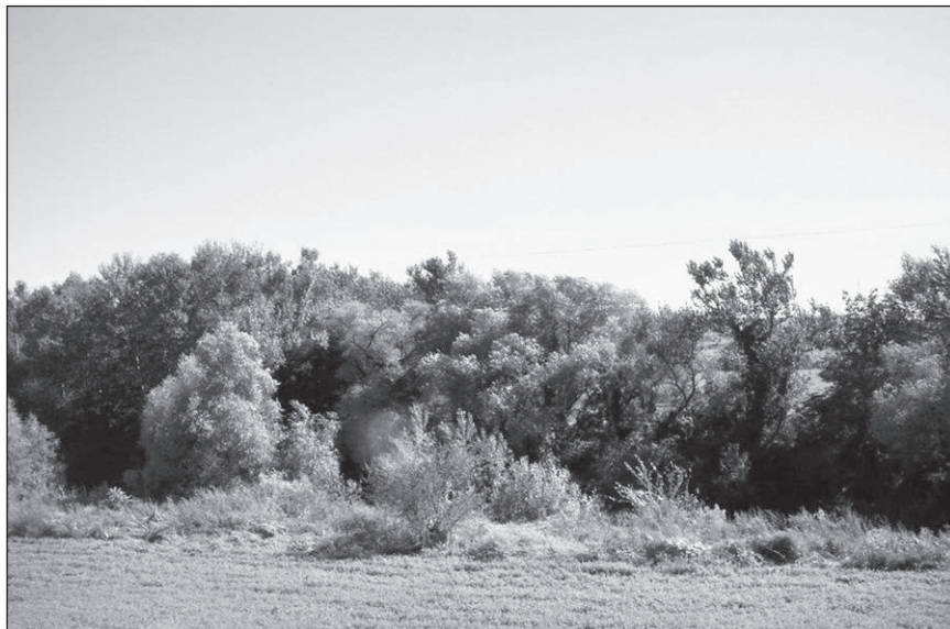
■ Foto 9. Valea Târnavei Mici, privită din dreptul fațadei sudice a castelului; pe țârmul opus, înspre sud, se desfășoară o pădurice