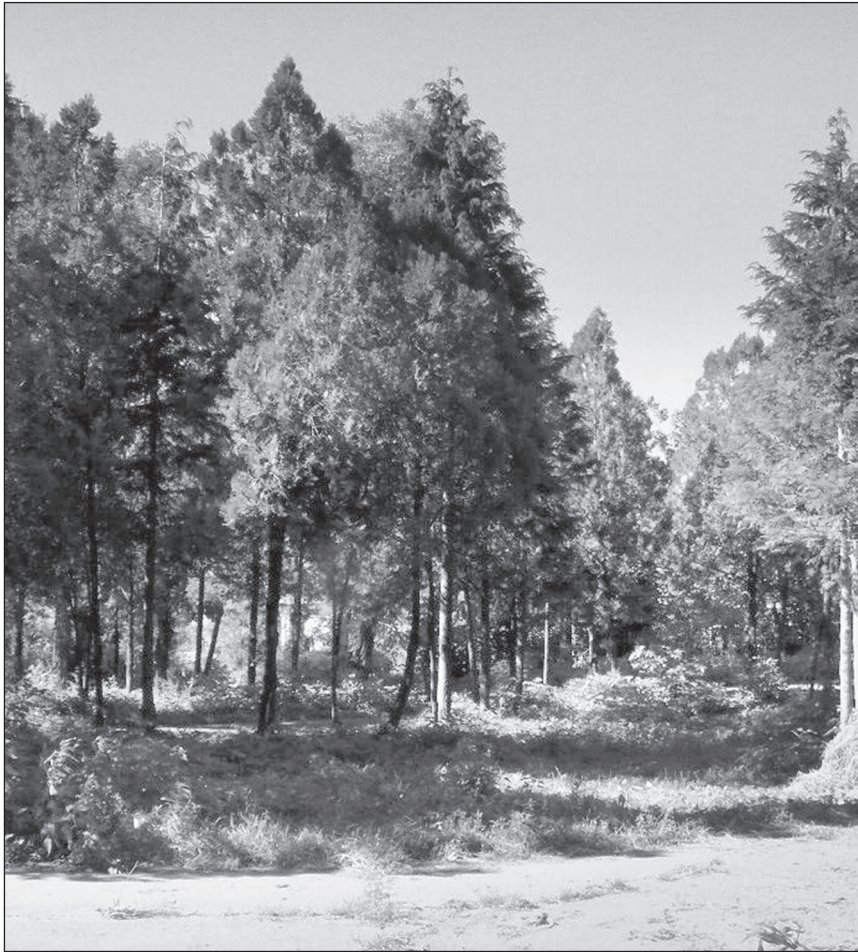
■ Foto 12. Rondoul plantat, în dreptul intrării în castel, privind înspre nord, la plecarea de pe amplasament