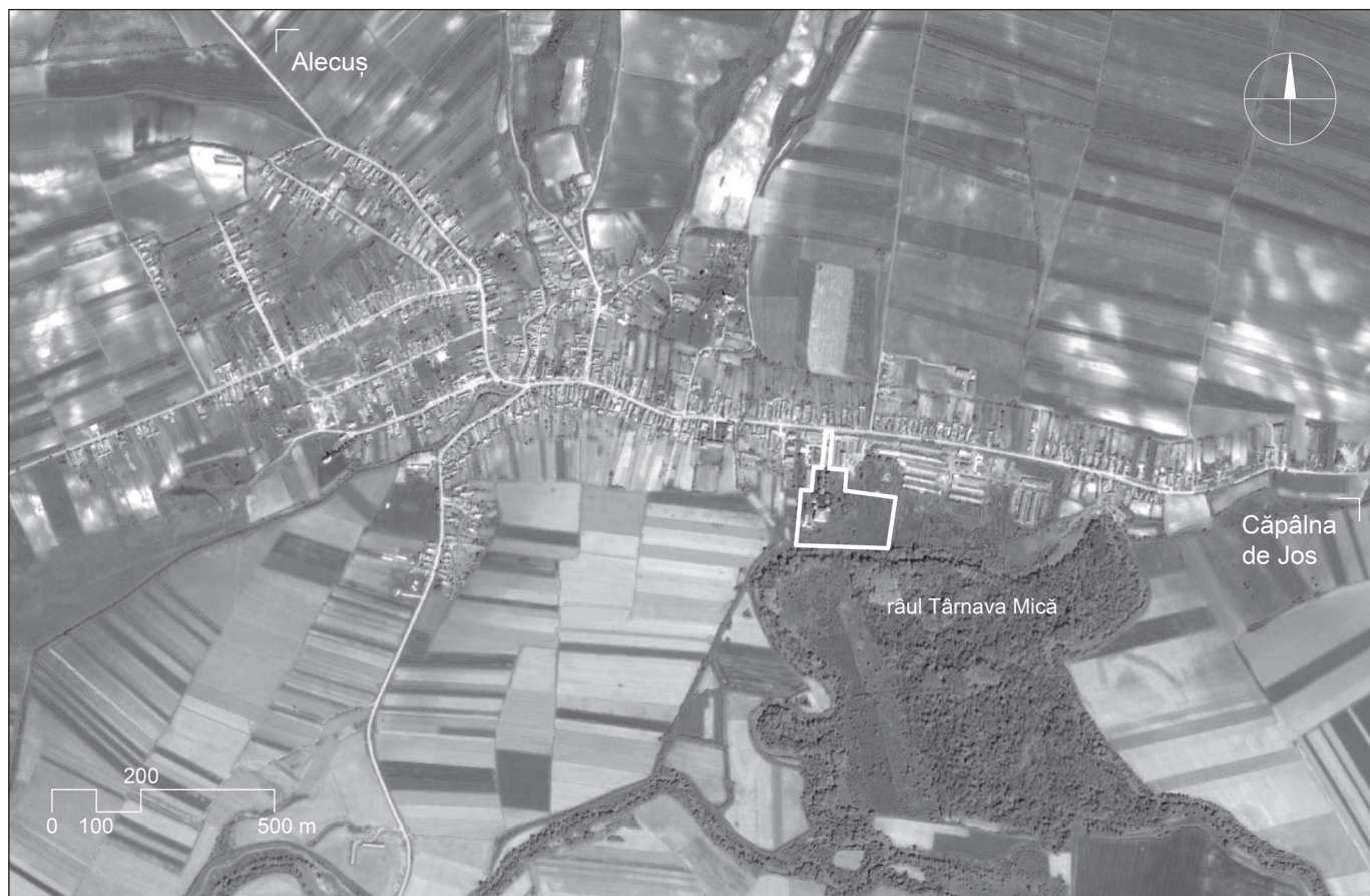
■ Foto 2. Ortophotografia satului Sânmiclăuș (2016). Conturul alb reprezintă amplasamentul ansamblului castelului Bethlen (însemnările grafice și textuale sunt adăugate de către autoare, scala grafică reprezentată este estimativă)