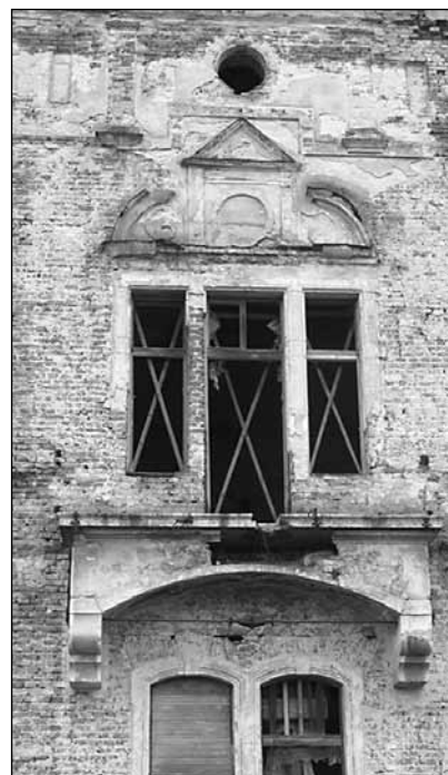
■ Foto 7. Castelul Teleki din Pribilești – detaliu.

17 GERLE János, MARÓTYZ Kata. op.cit. ; YBL, Ervin, op.cit. ; Magyar Katolikus Lexikon, accesat ultima dată în februarie 2014, la URL: http://lexikon.katolikus.hu/Y/Ybl.html ; www.ybl2014.hu .