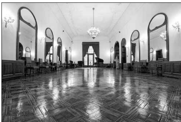
■ Foto 3. Castelul Károlyi – Sala de bal. © www.tripadvisor.com ■ Photo 3. Károlyi Manor House – ballroom. © www.tripadvisor.com