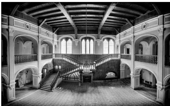
■ Foto 4. Castelul Károlyi – Sala cavalerilor. © www.tripadvisor.com ■ Photo 4. Károlyi Manor House – knights' room. © www.tripadvisor.com

dreptunghiulară. Între anii 1894-1896, se renovează pe baza planurilor lui Arthur Meinig, planuri influențate arhitectural de stilul castelelor franceze din secolul al XV-lea, construindu-se la colțuri turnuri cu acoperiș conic. Cu această ocazie, probabil, s-a refăcut și sala de bal, pe care o modificase arhitectul Miklós Ybl în anul 1847. Curtea interioară delimitată cu arcade devine atriumul castelului, „sala cavalerilor”. (Ca și în cazul altor castele, de mai multe ori reconstruite, și aici lipsesc sursele dateate, pe baza cărora am putea stabili perioadele de construcție, ca, de exemplu, prezența lui Ybl în acest proces). 9