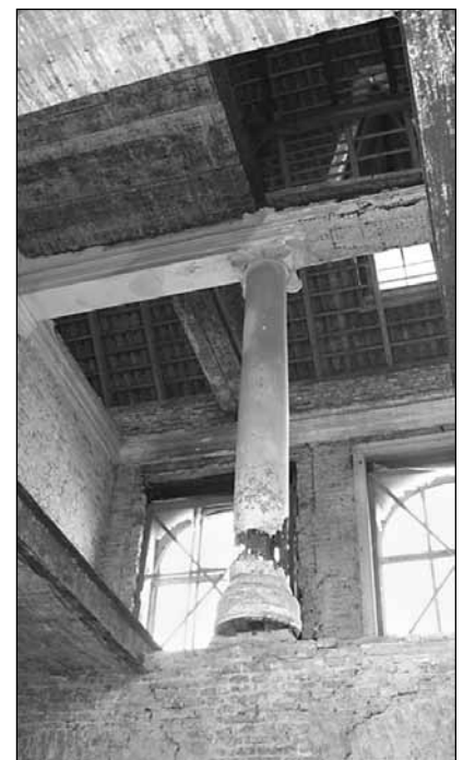
■ Foto 8. Castelul Teleki din Pribilești – interior.