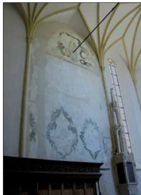
■ Foto 4. Corulul Bisericii din Deal (Sighișoara) cuprinzând traveea cu reprezentarea Sf. Magdalena cu donator din lunetă și tencuielile istorice pe care au fost descoperite ramele pictate ale unor dispărute ex-voto-uri