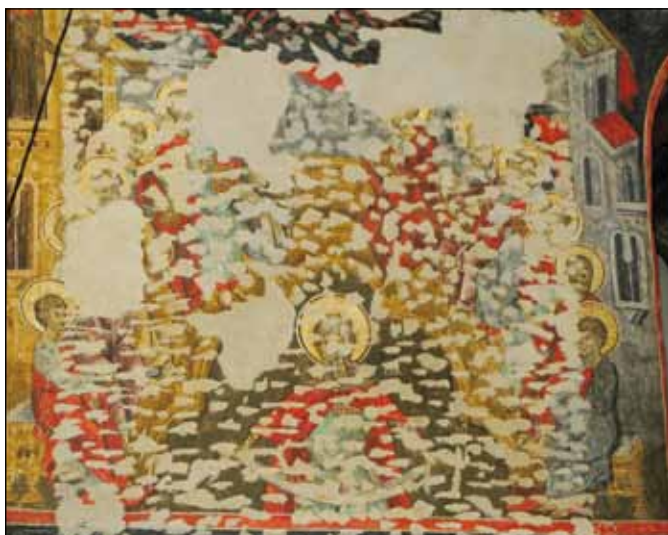
■ Foto 7. Scena Pogorării Duhului Sfânt din naosul Bisericii Doamnei din București. Restaurarea a păstrat memoria distrugerii picturii lui Constantinos tratând lacunele provenite din martelări ca nereconstituibile ■ Photo 7. Scene representing the Whit Sunday in the nave of Church of Our Lady in Bucharest. The restoration preserved the memory of Constantinos's painting destruction by treating the gaps arising from hammerings as unreconstructable