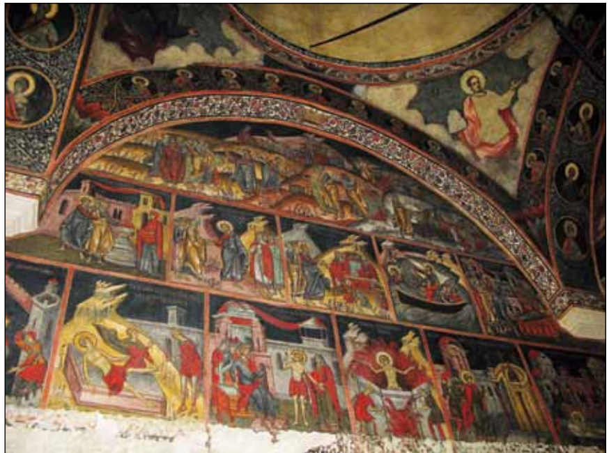
■ Foto 2. Biserica Doamnei din București. Peretele de Vest al pronaosului cuprinzând o parte din pictura zugravilor Constantinos și Ioan