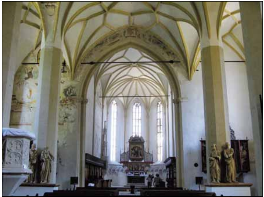
■ Foto 1. Biserica din Deal din Sighișoara după lucrările de conservare-restaurare: un exemplu de dialog între spațiul architectural și epiderma sa în diferite ipostaze