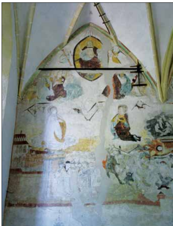
■ Foto 9. Judecata de Apoi, datorată picturului Valentinus, de pe peretele estic al navei Bisericii din Deal (Sighișoara) după operațiunile de conservare-restaurare ■ Photo 9. The Last Judgement, attributed to painter Valentinus, on the nave's eastern wall in Church on the Hill (Sighișoara) following the preservation-conservation works