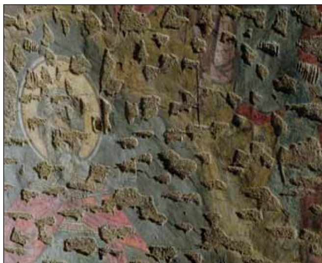
■ Foto 8. Martelări nereconstituibile din câmpul picturii murale la Biserica Doamnei din București ■ Photo 8. Unreconstructable hammerings from the field of the mural painting of Church of Our Lady in Bucharest

lacunare (foto 6). Acolo unde începe ipoteza reconstituirea încetează, afirmă sentențios BRANDI. În același timp, autorul Cartei Restaurării exclude analogia din planul metodologic al restaurării, 5 denunțând modul în care aceasta poate infiltra în substanța autentică a obiectului de patrimoniu intervenția arbitrară și falsul.