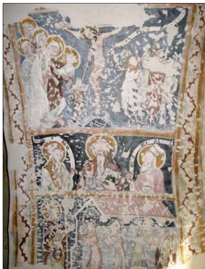
■ Foto 10. Cea mai veche pictură a Bisericii din Deal descoperită în bolta traveii sudice de la parterul turnului. Autorul restaurării: Romeo GHEORGHÎĂ ■ Photo 10. The oldest painting in Church on the Hill, discovered in the vault of the southern bay at the tower's ground floor. Restorer: Romeo GHEORGHÎĂ