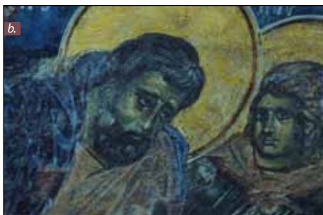
■ Foto 5. a-b. Biserica Domnească din Curtea de Argeș; restituirea prin cercetarea stratigrafică a imaginii autentice. Sf. Evangelist Marcu din pandantivul de Nord-Est înainte și după recuperarea imaginii de sub repictări