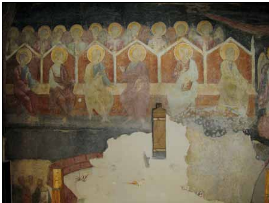
■ Foto 6. Lacune integrabile și neintegrabile în Judecata de Apoi din pridvorul Bisericii Doamnei din București