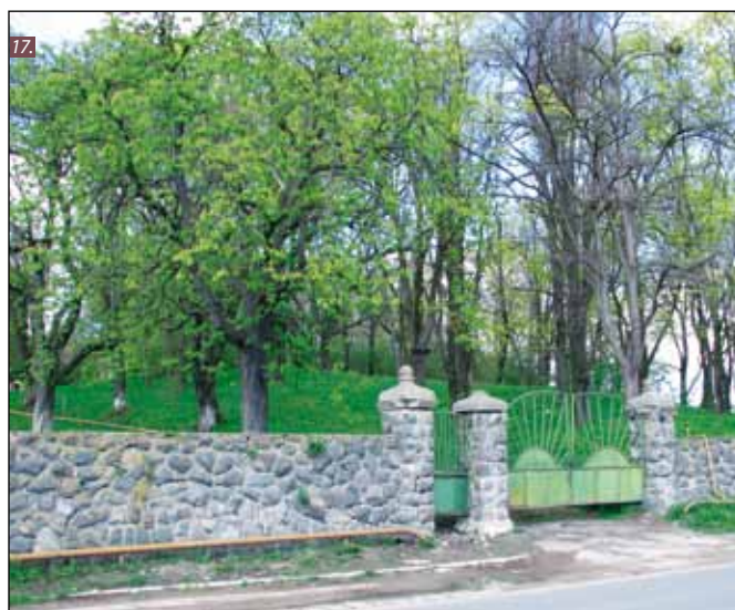
■ Foto 16. Aleea de acces principal în parc și spre castel. Pe fațada estică a castelului se observă gangul de intrare în curtea interioară și porticul cu trei deschideri de la nivelul parterului (2008). © Andreea MILEA ■ Foto 17. Împrejmuirea parcului și poarta accesului principal (2008). © Andreea MILEA