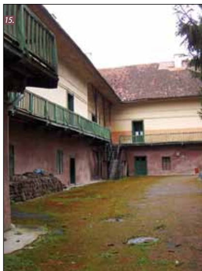
■ Foto 14. Zona accesului principal, în dreptul fațadei estice a castelului. În planul îndepărtat se observă accesul în parc de la parterul turnului sud-estic (2008). ■ Foto 15. Curtea interioară, cu galeria etajului și una din scările exterioare de acces la etaj.