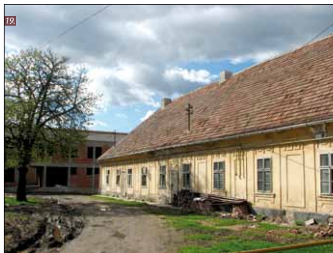
■ Foto 18. Șura barocă de la poalele nordice ale pîntenului de deal pe care este amplasat castelul (2008). © Andreea MILEA ■ Foto 19. Conacul Wass-Bánffy, situat înspre sud, în afara incintei parcului castelului (2008). © Andreea MILEA