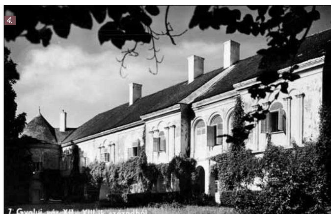
■ Foto 1. Ilustrată din 1910. Se observă arborii maturi, rondul ornamental, aliniamentele de gard viu tuns geometric. Fațada estică a castelului este aproape în întregime vizibilă, cu gangul de acces în curtea interioară, porticul cu trei deschideri și umbrarul de pe turnul nord-estic.  ■ Foto 2. Ilustrată din 1913. Se observă arborii maturi, rondul ornamental, aliniamentele de gard viu tuns geometric în dreptul fațadei estice a castelului. Umbrarul de pe turnul nord-estic a dispărut.  ■ Foto 3. Ilustrată de la începutul secolului al XX-lea. Se observă o serie de exemplare vegetale cu caracter decorativ în dreptul fațadei estice a castelului: arbuști, un exemplar de agave, două exemplare de zădă.  ■ Foto 4. Ilustrată din anii 1940. Se observă parterul îmbrăcat în plante agățătoare, aliniamentele din gard viu tuns geometric și mobilierul de grădină în dreptul fațadei estice a castelului.