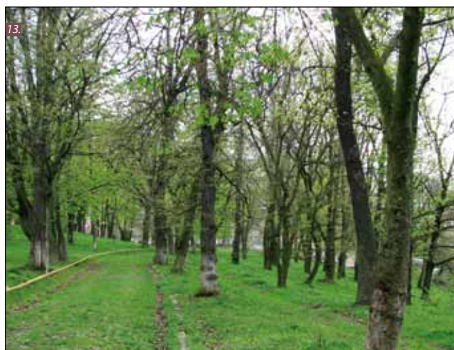
■ Foto 10. Aripa vestică a castelului (2008). © Andreea MILEA ■ Foto 11. Aripa nordică a castelului. Se observă urma fostului acces secundar în curtea interioară, înzidit în prezent, păstrând doar o mică ușă (2008). © Andreea MILEA ■ Foto 12. Fațada estică a castelului (2008). © Andreea MILEA ■ Foto 13. Aleea de acces principal în parc (aici privită spre ieșire). Pietruită la origine, acum e invadată de iarbă. Se observă bordurile din blocuri de beton și conducta de gaz condusă la suprafață, de-a lungul traseului aleii (2008). © Andreea MILEA ■ Photo 10. The castle's west wing (2008). © Andreea MILEA ■ Photo 11. The castle's north wing. Traces can be observed from the former secondary access, walled at present, preserving only a small door (2008). © Andreea MILEA ■ Photo 12. The castle's eastern elevation (2008). © Andreea MILEA ■ Photo 13. The main access alley (here seen towards the exit). Originally gravelled, it is now invaded by grass. The concrete curbs and the surface gas pipe along the alley can be observed (2008). © Andreea MILEA