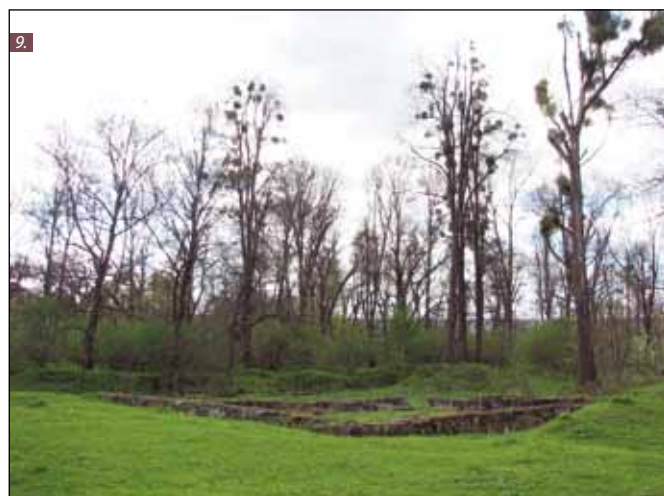
■ Foto 6. Pîntenul de deal pe care este amplasat castelul, privit dinspre nord, de pe drumul principal, de traversare a satului (2008). © Andreea MILEA ■ Foto 7. Parcul privit dinspre accesul secundar. Vestigiile ale castrului roman sunt vizibile în dreapta imaginii (2008). © Andreea MILEA ■ Foto 8. Castelul și parcul privite dinspre accesul secundar. În dreapta imaginii sunt vizibile vestigiile ale castrului roman, iar în stînga micile construcții anexe (2008). © Andreea MILEA ■ Foto 9. Vestigiile ale castrului roman în apropierea castelului (2008). © Andreea MILEA ■ Photo 6. The hill spur on which the castle is placed, seen from the north, from the main road that crosses the village (2008). © Andreea MILEA ■ Photo 7. The park seen from the secondary access. Remains from the Roman fort are visible in the image's right side (2008). © Andreea MILEA ■ Photo 8. The castle and park seen from the secondary access. Remains of the Roman fort are visible on the right side, while on the left there are small annex buildings (2008). © Andreea MILEA ■ Photo 9. Remains of the Roman fort near the castle (2008). © Andreea MILEA