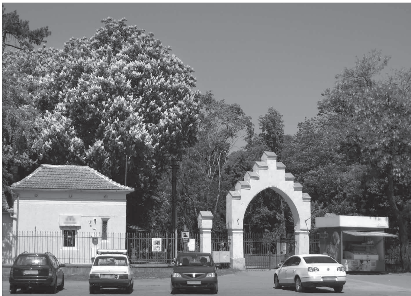
■ Foto 7. Poarta neogotică, păstrată în colțul sud-estic al parcului (2013).