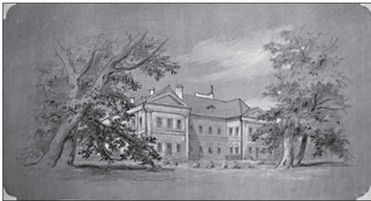
■ Foto 1. Vedere dinspre est a castelului, la începutul secolului al XIX-lea. © e-castellum

■ Photo 1. View of the castle from the east, at the beginning of the 19 th century. © e-castellum