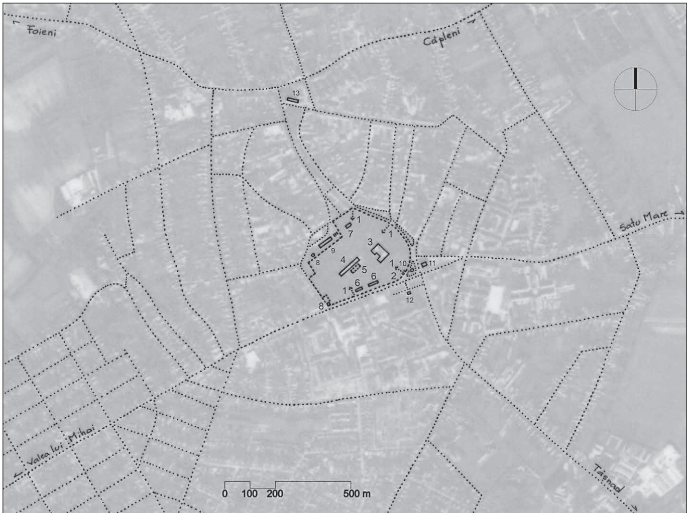
■ Fig. 4. Încadrarea ansamblului castelului Károlyi în localitate și dispunerea elementelor majore ale ansamblului și din vecinătate: 1 – acces în incinta parcului castelului, 2 – poarta neogotică, 3 – castelul Károlyi, 4 – grajd-manej, 5 – teren de sport, 6 – anexe (ruinele fostelor case pentru personal), 7 – terasă de parc amenajată în ruinele unei foste construcții anexe, 8 – turn de apă, 9 – sere, 10 – fântână arteziană, 11 – biserica ortodoxă, 12 – Monumentul Eroilor Români din cel de-al Doilea Război Mondial (VIDA Géza, Anton DĂMBOIANU, 1964), 13 – biserica catolică (reconstituirea autoarei, suprapusă unei ortofotografii: GoogleEarth 2010; scala grafică reprezentată este estimativă). © Andreea MILEA ■ Figure 4. The placement of Károlyi Castle compound within the settlement and of the major elements of the compound and of those in its vicinity: 1 – access to the castle park premises, 2 – Neo-Gothic gate, 3 – Károlyi Castle, 4 – stables-manège, 5 – sports field, 6 – annexes (the ruins of the former servants' quarters), 7 – park terrace within the ruins of a former annex building, 8 – water tower, 9 – greenhouse, 10 – fountain, 11 – Orthodox church, 12 – Monument of the Romanian Heroes of the Second World War (VIDA Géza, Anton DĂMBOIANU, 1964), 13 – Catholic church (author's reconstruction, superposed over an orthophotography: GoogleEarth 2010; the represented graphic scale is estimative) © Andreea MILEA

Landscape. Carei is situated in a plains landscape, Câmpia Careilor, without any important watercourse crossing it.