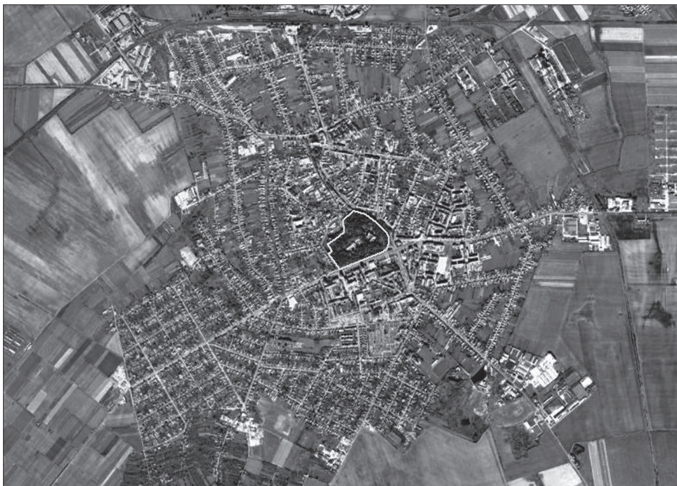
■ Foto 3. Ortofotografia orașului Carei (2010). Conturul alb reprezintă limita actuală, aproximativă, a parcului castelului Károlyi.