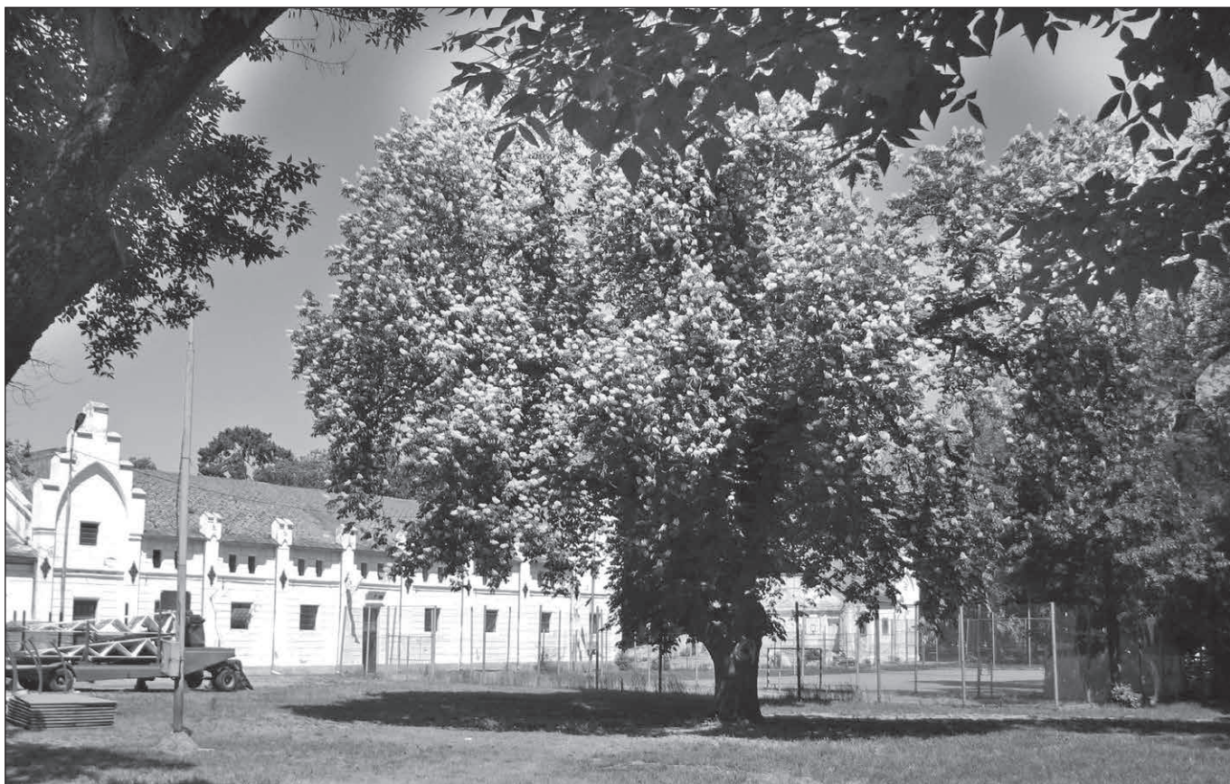
■ Foto 6. Manejul-grajd-șopron și terenul de sport, în zona centrală a parcului (2013). © Andreea MILEA ■ Photo 6. The manege-stables-shed and the sports field, in the park's central area (2013). © Andreea MILEA

both through the deviation of the former road network (especially those to the east and south that, until then, passed next to the castle) and, probably, by incorporating some of the neighbouring built plots (to the north and west).