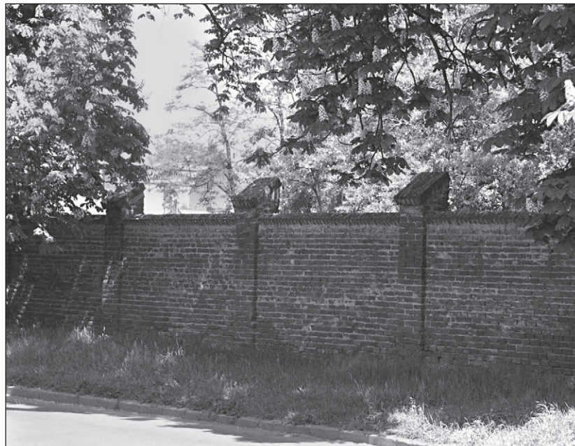
■ Foto 5. Detaliu al împrejurii parcului, pe laturile vestică și nordică (zidărie de cărămidă) (2013). © Andreea MILEA ■ Photo 5. Detail of the park's enclosure, on the western and northern sides (brick masonry) (2013). © Andreea MILEA