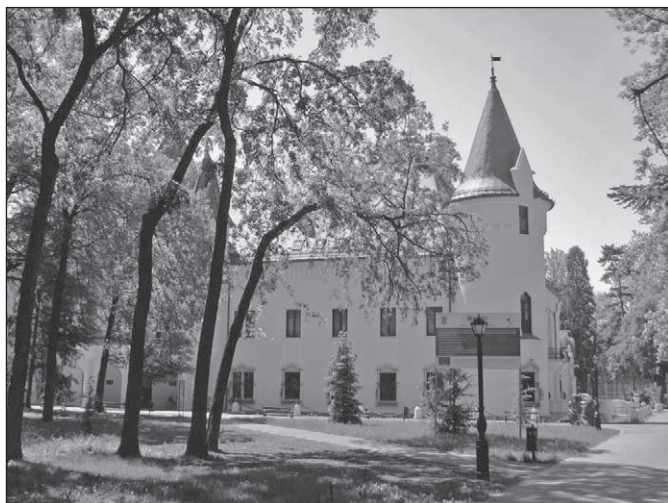
■ Foto 12. Aleea de acces înspre castel, dinspre latura estică a parcului (2013). © Andreea MILEA

■ Photo 12. The alley of access to the castle, from the eastern side of the park (2013). © Andreea MILEA