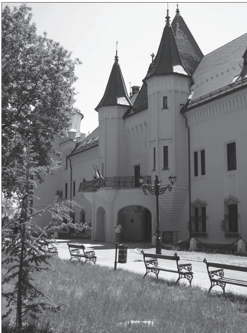
■ Foto 14. Intrarea principală, pe fațada estică a castelului (2013). © Andreea MILEA ■ Photo 14. Main entrance, on the castle's eastern elevation (2013). © Andreea MILEA