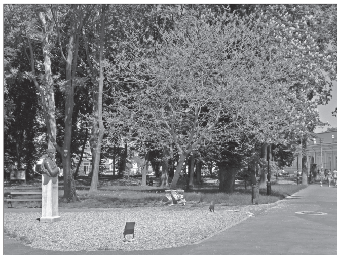
■ Foto 13. Aleea de acces în parc, pe latura estică a acestuia, și bustul lui Sándor KÁROLYI (2013). © Andreea MILEA

■ Photo 12. The alley of access to the castle, from the eastern side of the park (2013). © Andreea MILEA