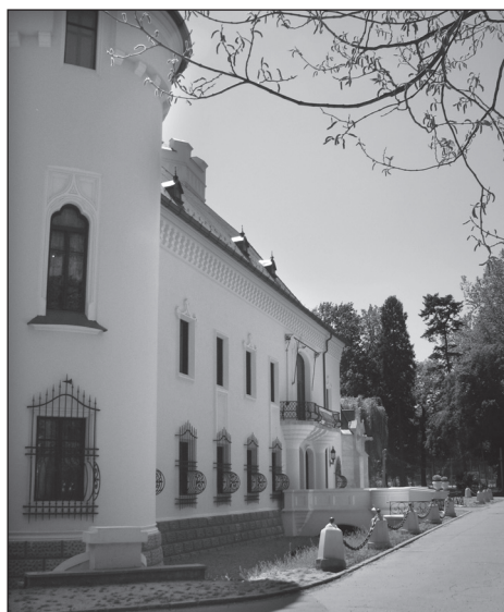
■ Foto 15. Intrarea dublă, precedată de pod, pe fațada nordică a castelului (2013). © Andreea MILEA ■ Photo 15. Double entrance preceded by the bridge, on the castle's northern elevation (2013). © Andreea MILEA