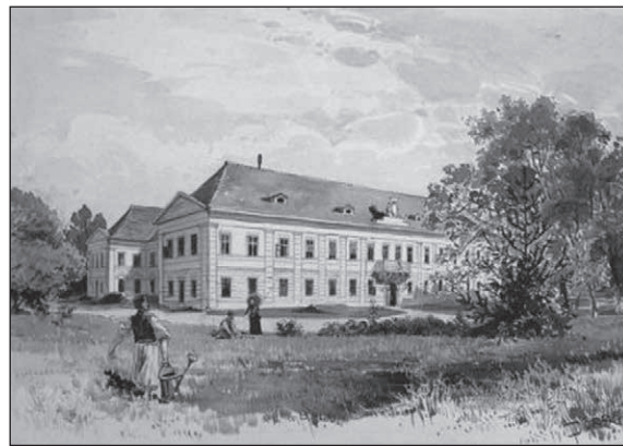
■ Foto 2. Vedere dinspre sud a castelului, la începutul secolului al XIX-lea. © e-castellum

■ Photo 1. View of the castle from the east, at the beginning of the 19 th century. © e-castellum