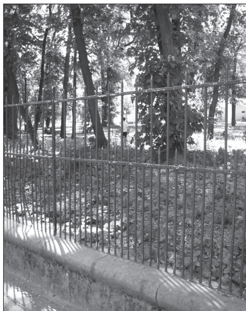
■ Foto 4. Detaliu al împrejurii parcului, pe laturile sudică și estică (soclu din piatră și panouri din fier forjat) (2013). © Andreea MILEA ■ Photo 4. Detail of the park's enclosure, on the southern and eastern sides (stone pedestal and wrought iron panels) (2013). © Andreea MILEA