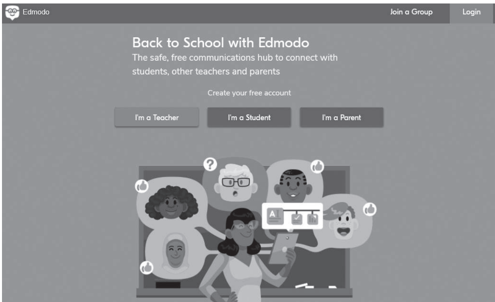
1. ábra. Az Edmodo weboldal kezdőlapja

Az edmodo.com weboldalt felkeresve egy könnyen navigálható kezdőlap fogadja a látogatókat. Három fő profilt biztosít az Edmodo ; tanár (I'm a Teacher), diák (I'm a Student) és szülő (I'm a Parent) (1. ábra). Bármelyik opcióra kattintva lehetőség van hagyományosan e-mail és jelszó megadásával regisztrálni, illetve a Google vagy Microsoft Office 365 fiókkal összekötve néhány kattintással könnyedén be lehet lépni.