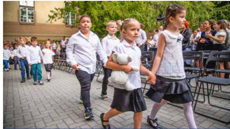
Tanévnyitó az Erkel iskolában

Szeptember elsejével a kispesti általános és középiskolákban is megkezdődött a 2023/2024-es tanév. Vinczek György alpolgármester az Erkel iskola és a Deák gimnázium évnyitóján is részt vett.