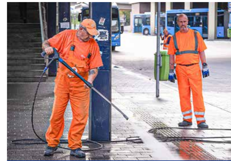
Ez volt az év utolsó „vizes” akciója

A Tisztább és biztonságosabb Budapestért kampány keretében újabb közös, fővárosi és kerületi köztisztasági és közbiztonsági akciót tartottak augusztus utolsó napján a KöKi-n. A munkát a Főkert, valamint az FKF Hulladékgyűjtési és Köztisztasági Di-