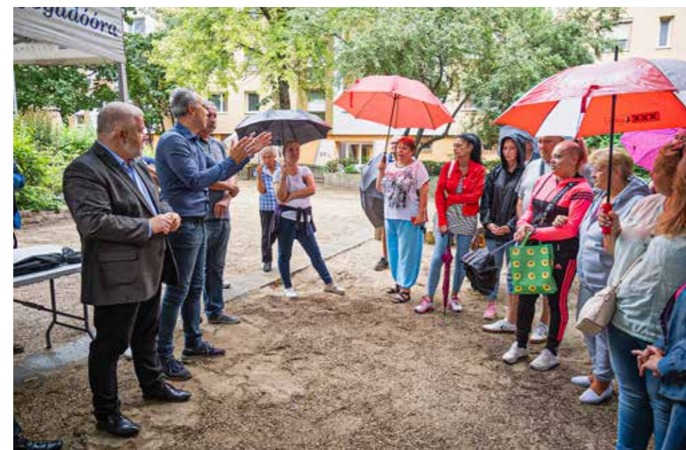
Rendezett környezetet akarnak a lakók

A Lehel és az Eötvös utcai lakótömbben élők szeretnék, ha megszűnne a randalírozás, a drogozás és a drogárúsítás, eltűnnének a hajléktalanok, megoldódnának a parkolási gondok. Azt akarják, hogy rendezett, családbarát legyen a környezetük napközbeni és éjszakai hatósági ellenőrzéssel, járőrözéssel; javuljon a közvilágítás; az önkormányzat telepítsen térfigyelő kamerát; elkerített, gondozott, parkos terület és játszótér legyen a házak között. A közös gondolkodás és ötletelés folytatódik.