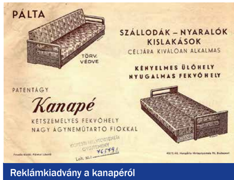
Reklamkiadvány a kanapéról

A rekamié, esetleg szófa, ahogy ma gondolunk rá, az 1600-as évek francia udvarában honosodott meg. Fő célja, hogy kényelmesen letelepedhessen egyszerre több ember. A magyarban meghonosodott kanapé kifejezés is francia, eredetileg baldachinos ágyat jelent. De hogyan alakult az ágygá alakítható ülőbútorok sorsa a világban? Már az 1800-as évek végén jelentettek be szabadalmakat mesterek, akik különféle megoldásokkal álltak elő a kinyithatóság problémájának megoldására. Az 1930-as évektől Budapesten is találunk egyedi gyártókat, akik próbálkoztak ennek, az egyébként igen praktikus bútornak az elkészítésével. Az ágygá alakítható rekamiék a lakások zsúfoltságát kívánták enyhíteni, de alkalmasak lehetnek vendégek fogadására, illetve szállodák számára is. Tömeges gyártásuk az USA-ban kezdődött, a század közepe-től.