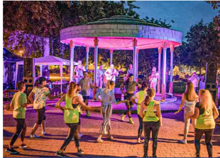
Szombat esti tánc