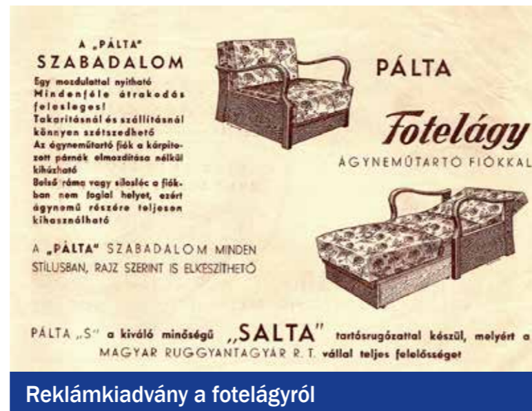
Reklamkiadvány a fotelágyról

A kinyitható rekamiék problémája az volt, hogy csak hirdetések állították, hogy haszná-